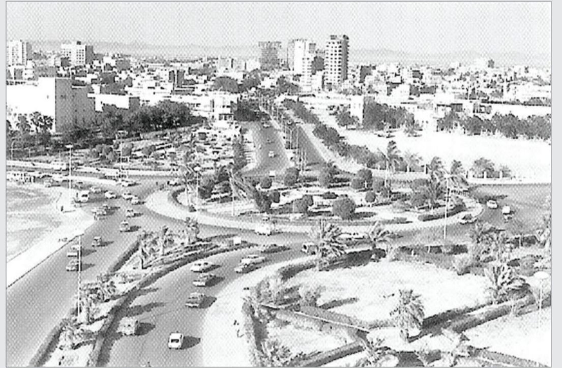
من مدينة جدة

بوزارة المالية والاقتصاد الوطني حملاتها التفتيشية في الاحصاء الزراعي على كل من مدينة تبوك وحائل والجوف والقريات وعرعر وتضم هذه اللجنة ثلاثين موظفاً آخرين من الموظفين المختصين.