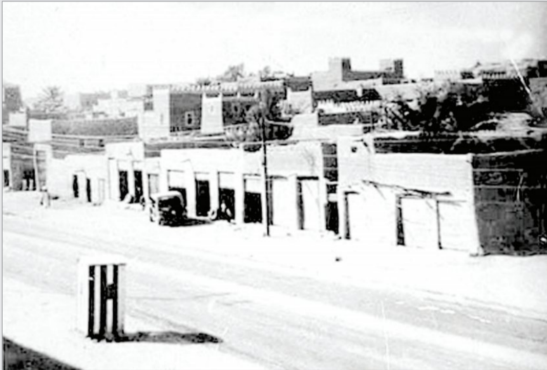
مخلة شرطي في بريدة قبل عدة سنوات