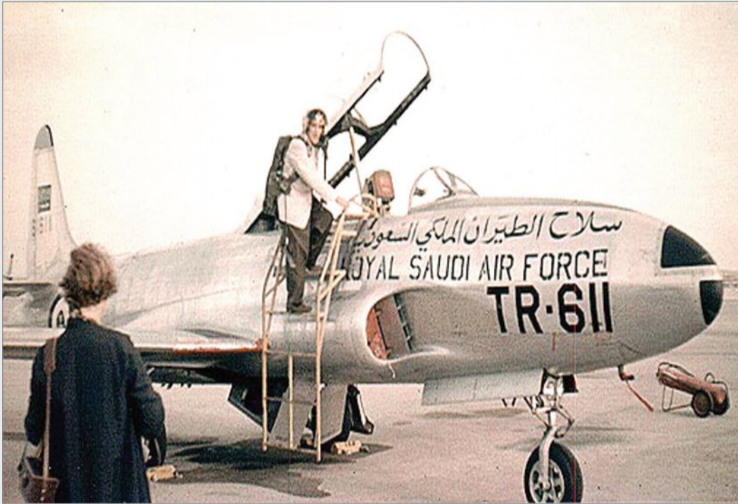
احدى اوائل الطائرات بسلاح الطيران الملكي السعودي