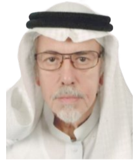
عبد المؤمن القين

في عهد النبي صلى الله عليه وسلم، بدأت سرية عبدالله بن جحش رضي الله عنه، بأول قتال بين المسلمين وقريش، وكانت السرية من أجل التعرض لقافلة قريش القادمة من الشام والنيل من الغنائم بدون قتال، تويضاً لما استولت عليه قريش من أموال المسلمين في مكة قبيل خروج النبي صلى الله عليه وسلم مهاجراً للمدينة المنورة، وأمر عبدالله بن جحش بأن يتعرض للقافلة المشركين دون قتال ولكن وقع القتال وعادت السرية للمدينة ومعها أسيران - حسب علمي - وإعلامياً احتجت قريش وقالت: كيف يقاتل محمد وهو في أشهر حرم؟ فنزل قول الله تعالى: (يَسْأَلُونَكَ عَنِ الشَّهْرِ الْحَرَامِ قِتَالٍ فِيهِ قُلْ قِتَالٌ فِيهِ كَبِيرٌ وَصَدُّ عَنْ سَبِيلِ اللَّهِ وَكَفْرٌ بِهِ وَالْمَسْجِدِ الْحَرَامِ وَإِخْرَاجُ أَهْلِهِ مِنْهُ أَكْبَرُ عِنْدَ اللَّهِ وَالْفِتْنَةُ أَكْبَرُ مِنَ الْقِتَالِ وَلَا يَزَالُ الَّذِينَ يَأْتُونَكَ حَتَّى يَرْدُوكَ عَنْ دِينِكَ إِِنْ اسْتَطَاعُوا وَمَنْ يَرْتَدِدْ مِنْكُمْ عَنْ دِينِهِ قِيمَتُهُ مِمَّا كَفَرَ فَأُولَئِكَ حَبِطَتْ أَعْمَالُهُمْ فِي الدُّنْيَا وَالْآخِرَةِ وَأُولَئِكَ أَصْحَابُ النَّارِ هُمْ فِيهَا خَالِدُونَ)، فوزع النبي صلى الله عليه وسلم أول خمس في الإسلام ثم قابل مندوب قريش وتجلي العامل الإنساني في عدم الرجز بالأسيرين في السجن كما يفعل الطغاة الآن. وفي فتح خيبر، أمر النبي صلى الله عليه وسلم أصحابه بأن لا يقتلوا النساء ولا الأطفال دون الرابعة عشرين العمر، إنها إنسانية التعامل مع العدو ليكون الباب أمامه مفتوحاً للتفكير، وبالتالي ليتعرف على حقيقة نبوة محمد صلى الله عليه وسلم، فنبوته رحمة للناس وليست انتقاماً، فبابي أنت وأمي يارسول الله.