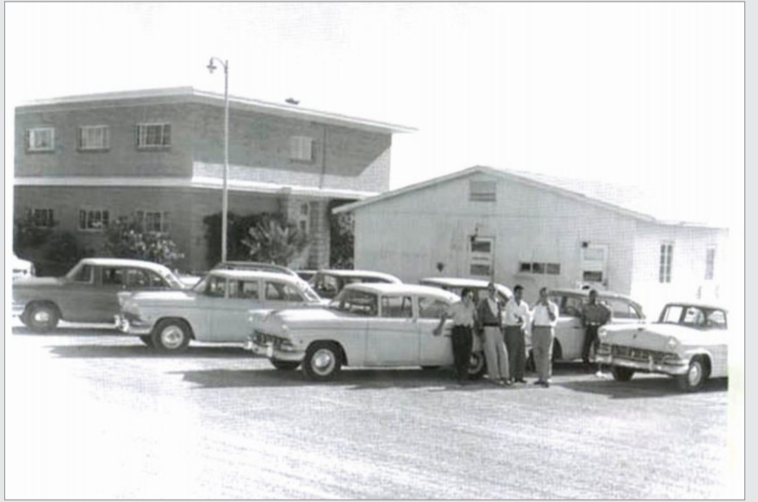
موقف السيارات الخاص ب سق بنفسك