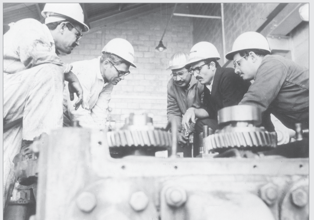
برنامج ارامكو التدريبي على الصيانة الاعلى لآلات والاجهزة الالكترونية