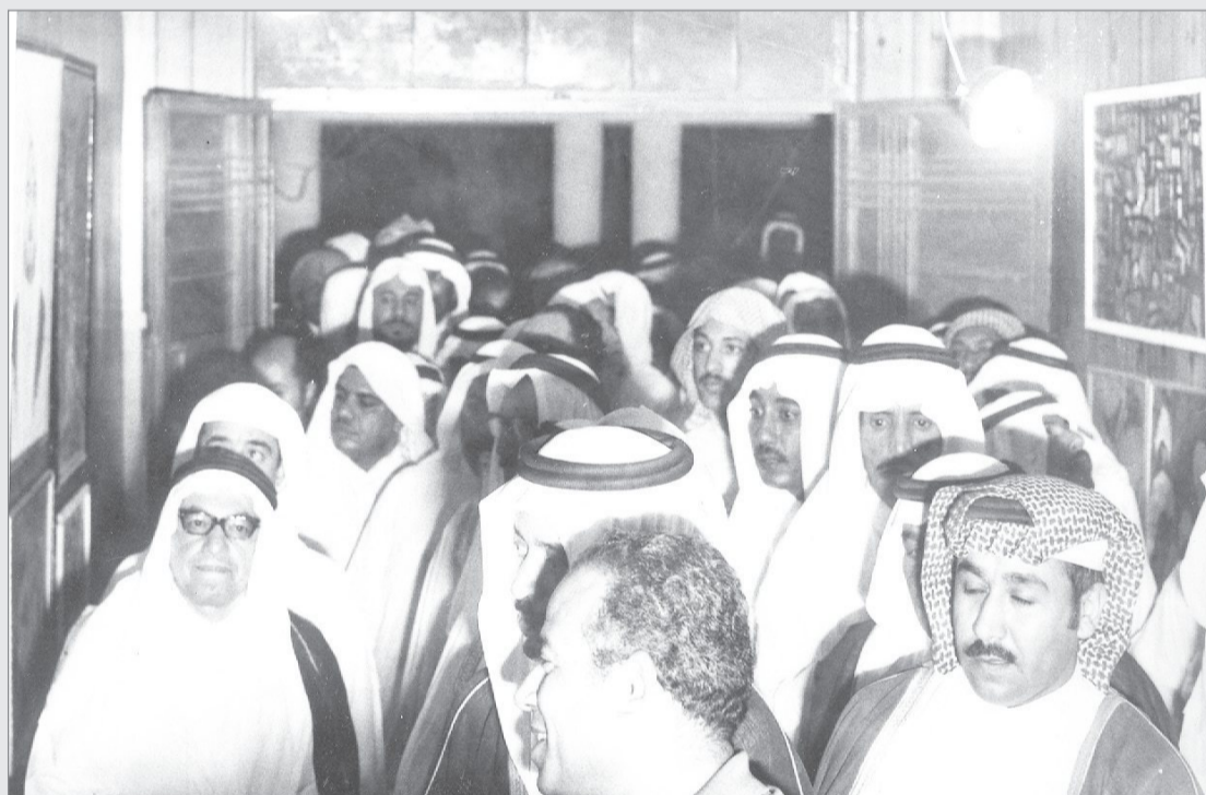
زوار معرض الفنون التشكيلية بنادي المدينة الادبي