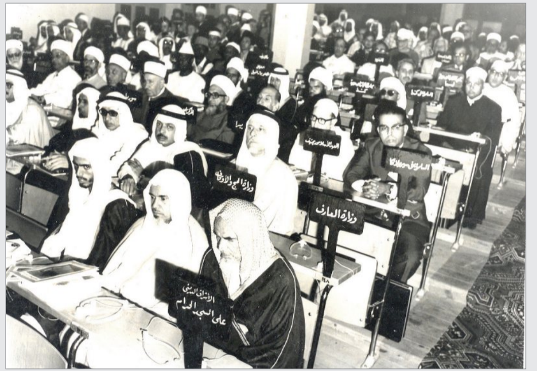
المؤتمر الاول لرسالة المسجد