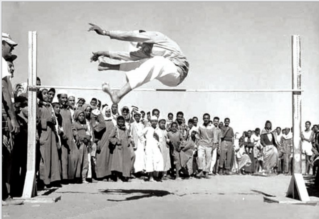
طلاب في نشاط رياضي مدرسي عام ١٩٥٦ في طريف