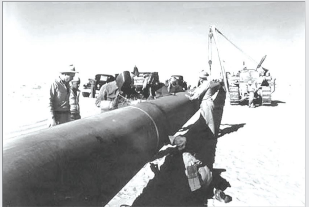
عملية لحام انابيب التابطين

عناية العلمي وقد بدأت اذاعة المعهد نشاطها فأخذت تديع برامج هامة ونشرة اخبار يومية على الطلاب وقد زودت جمعية الاذاعة بجهاز مكبر الصوت كبير الحجم واعمال الجمعية تسير على ما يرام.