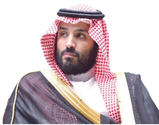
ولي العهد ورئيس الوزراء الكندي يبحثان العلاقات والمستجدات