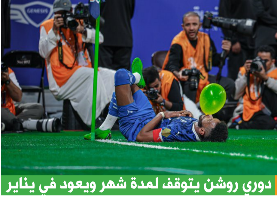
دوري روشن يتوقف لمدة شهر ويعود في يناير