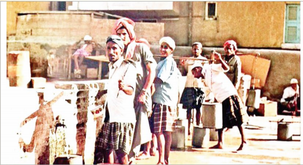
بازارات المياه في جدة