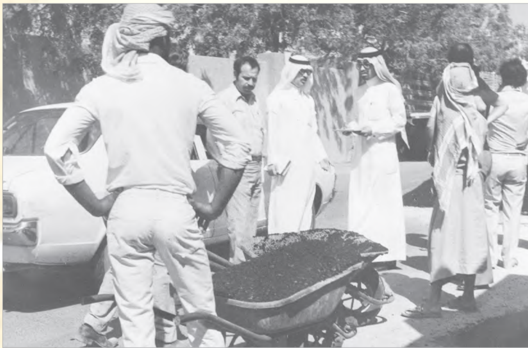
احد المراقبين يقوم بتحرير مخالفة لعدم مطابقة الاسفلت للمواصفات