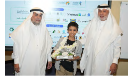
جدة - البلاد

في خطوة تعكس التزامها المستمر بدعم مرضى سرطان الأطفال وأسرهم، دشنت جمعية سند الخيرية خطتها الاستراتيجية الثانية، والتي تهدف إلى تعزيز خدمات الرعاية والدعم النفسي بالسرطان وعائلاتهم. تضمن حفل التدشين الذي أقيم في أحد الفنادق بجدة، حضور عدد من الأطباء