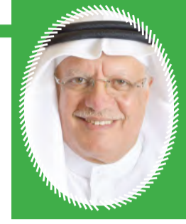
قراءة: صالح عبدالله بوقري

شحوب ..... غادرت على عجل.. اللوحه لم تكتمل وكذا فرحتك الجديدة لم تكتمل بعذك الأيام موحشة تراب ينهال فوق تراب وتركتنا ننصت لوقع خطاك في العراء حيث الأرض كل الأرض قبور وكل الشوق عاصفة من لهيب وكل جبين غلالة من كأنما خيالاً من نور عبرت غادرت على عجل.. تركت أشياءك بيننا تنتظر.. عنك تحدثنا ..... مضيت