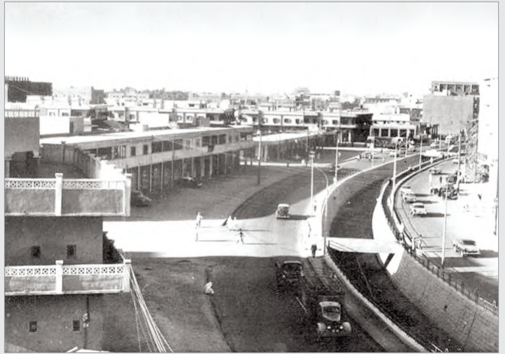
طريق الملك سعود - الرياض