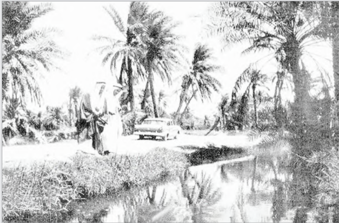
بستين - الهفوف