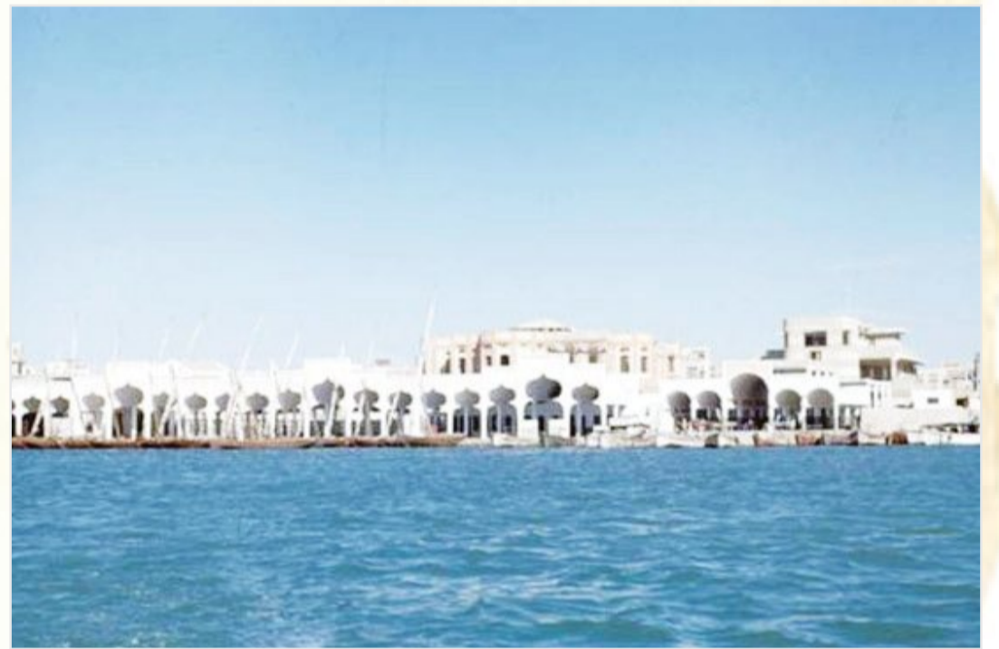
مبنى الجمارك بجدة ١٩٤٧م