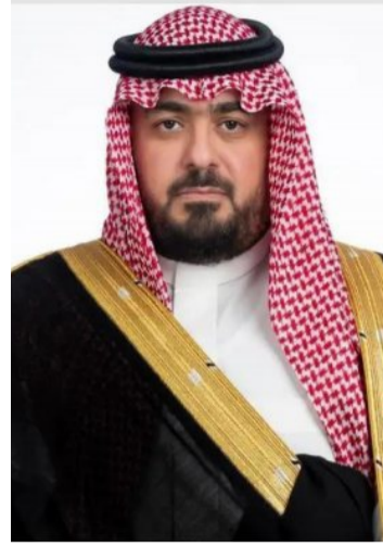
الفرص والموارد والخدمات الأساسية.

أكد معالي وزير الاقتصاد والتخطيط الأستاذ فيصل بن فاضل الإبراهيم أن جهود المملكة في المحافل الدولية ودورها بصفتها شريكاً فاعلاً في مجموعة العشرين أسهمت في تطوير سياسات وبرامج تعزز الاستقرار الاقتصادي العالمي وتقلل الفجوات التنموية بين الدول. وأوضح بمناسبة انعقاد اجتماع قمة قادة مجموعة العشرين، "تشارك دول مجموعة العشرين في عدد من الرؤى والتطلعات التنموية، حيث تركزت جهود الدول الأعضاء على تكثيف التعاون الدولي وبناء شراكات إستراتيجية تسهم في تحقيق أهداف التنمية المستدامة على الصعيدين الإقليمي والدولي، كما تسعى دول المجموعة في أجندة قمة قادة مجموعة العشرين من كل عام إلى توظيف خبراتها وتجاربها المتنوعة في مختلف المجالات، من أجل الاستجابة العاجلة للتحديات العالمية المتسارعة وتقديم الحلول المبتكرة والمساهمة في تعزيز رفاهية الأفراد والمجتمعات".