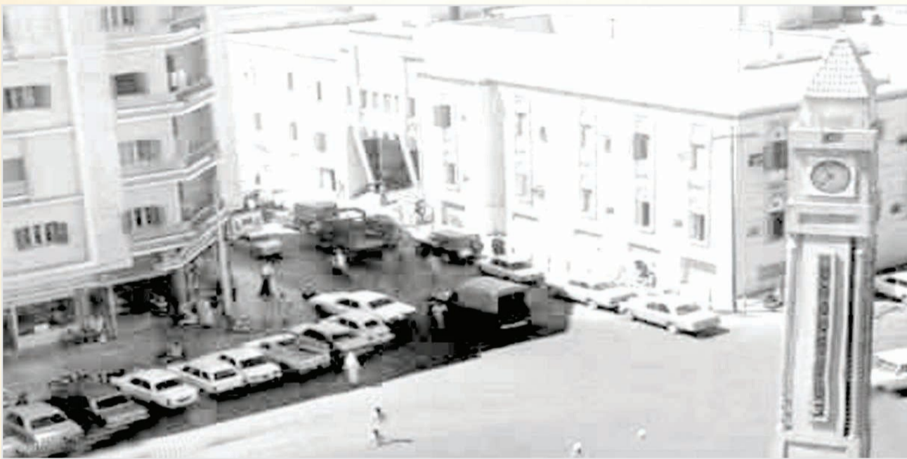
الديرة - مدينة الرياض