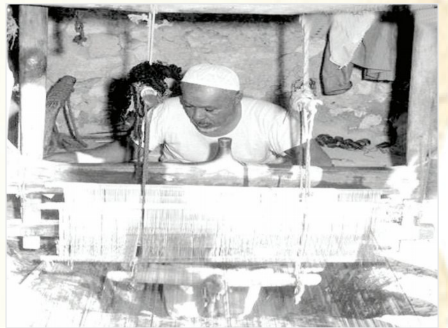
حائك من الاحساء - مطلع الثمانينات