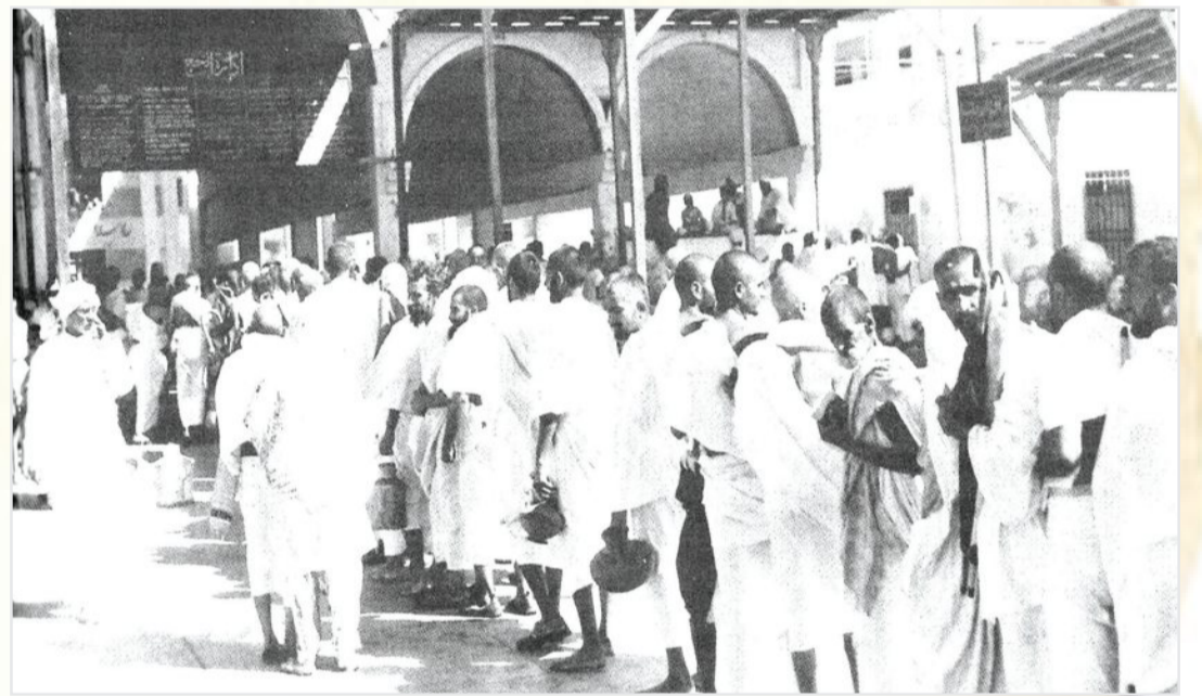
المحجر الصحي بمنى