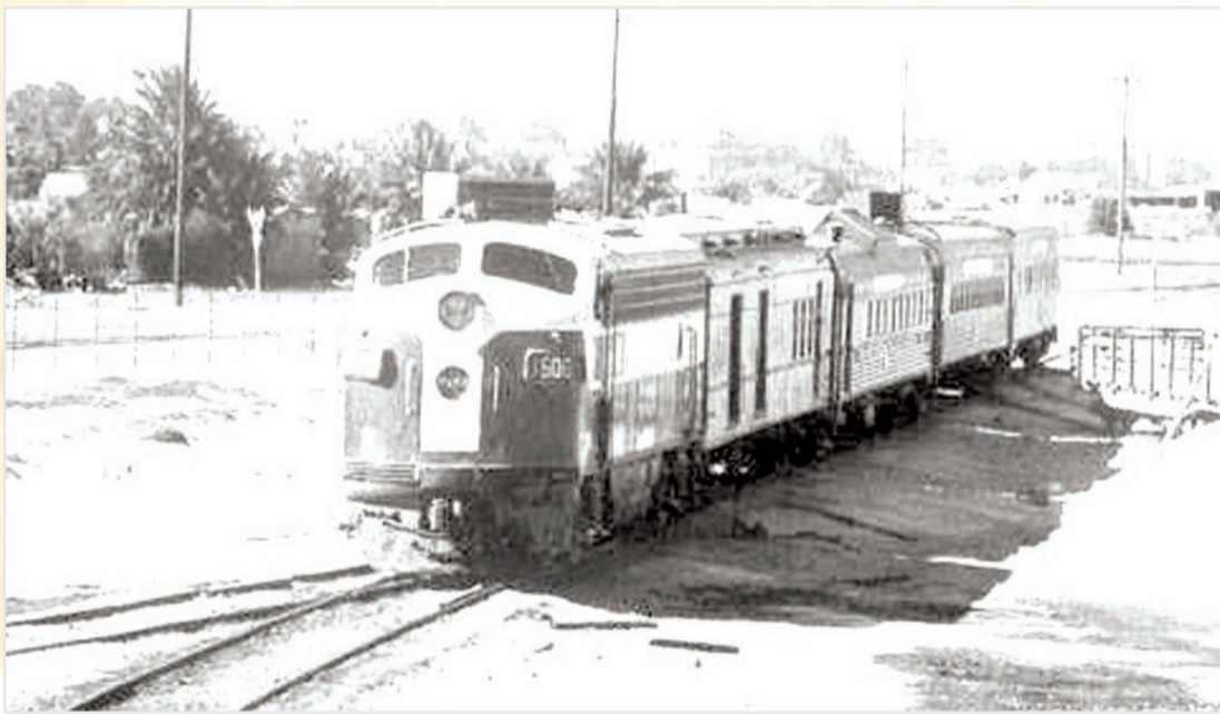
القطار - بداية السبعينيات الميلادية