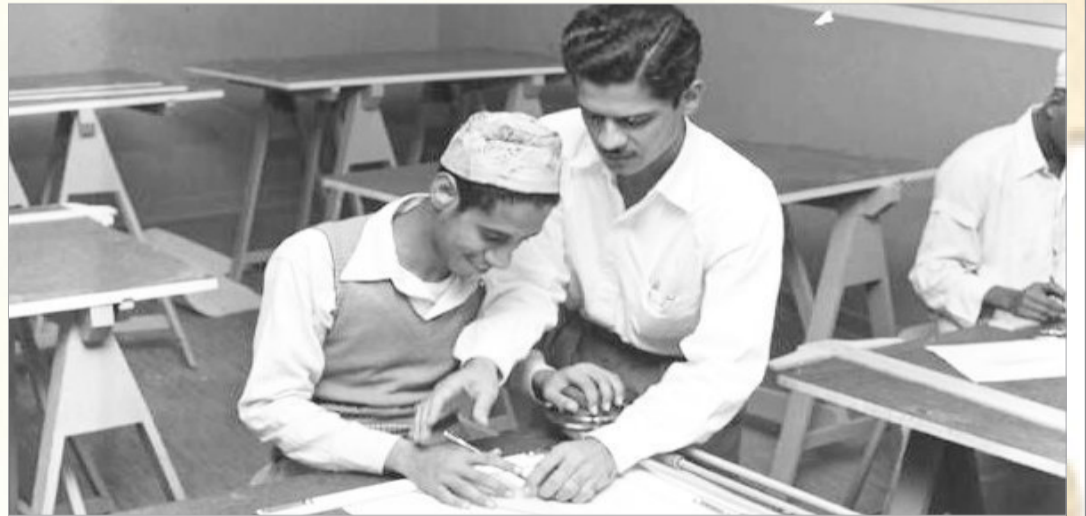
حصة الرسم الهندسي