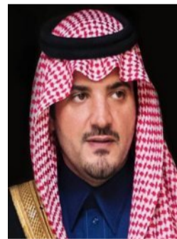
عبد العزيز بن سعود بن نايف

وأشار إلى أن حفل هذا العام يأتي والجامعة قد عززت خطواتها نحو التميز والجودة بحصولها على الاعتماد المؤسسي "الكامل" إلى عام 2031م من هيئة تقويم التعليم والتدريب، ممثلة بالمركز الوطني