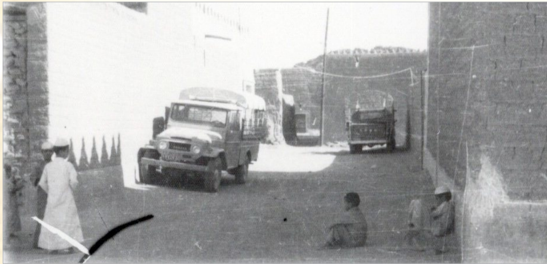
حي البلدة في حائل