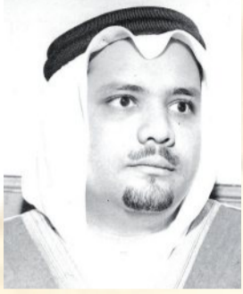
أحمد زكي يمانى