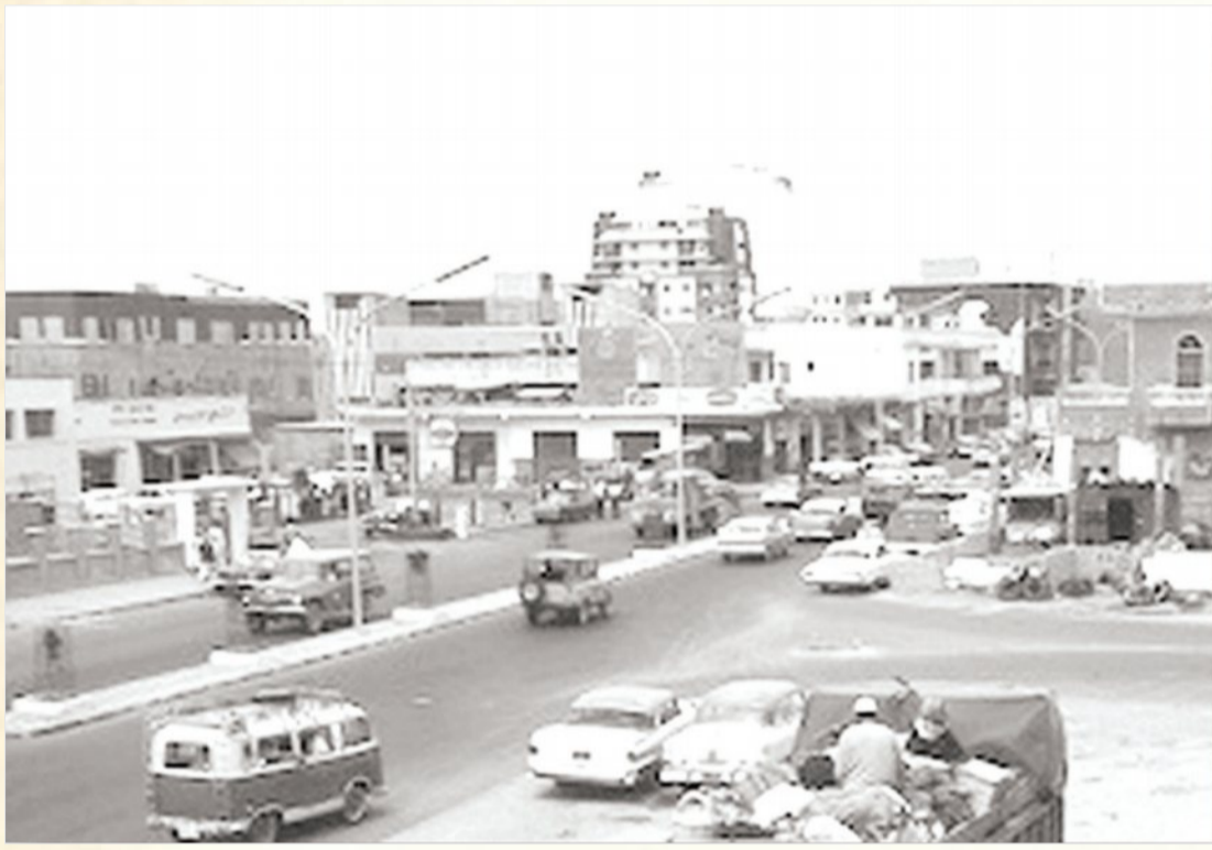
جدة في الستينيات الميلادية