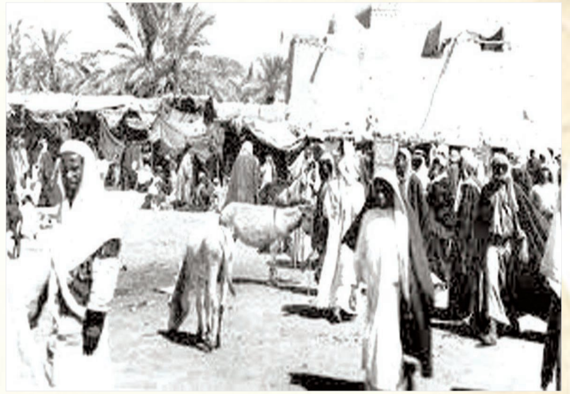
جزء من سوق الرياض القديم