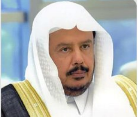
المملكة بقيادة الرشيدة حريصة على وحدة العمل الخليجي