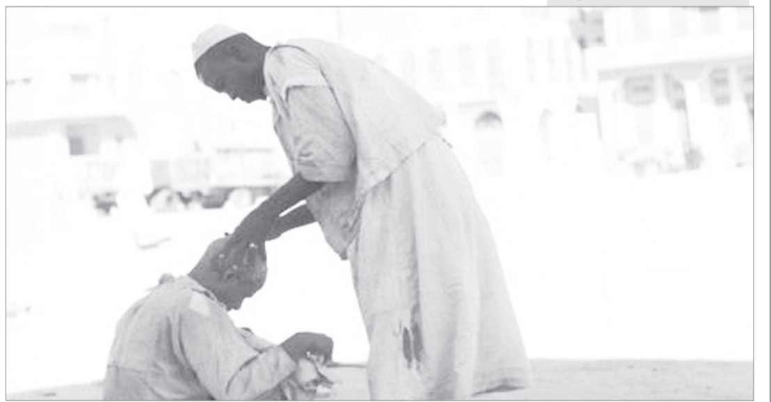
احد الحلاقين في شوارع جدة، وحلاقة في الهواء الطلق - نهاية الاربعينيات