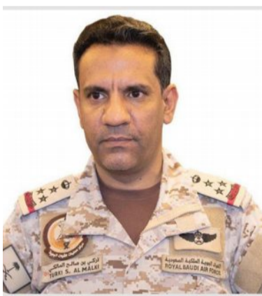
العميد تركي المالكي

لقوات الشرعية اليمنية بمدينة سيئون اليمنية، مما أدى إلى استشهاد ضابطين سعوديين، وإصابة ضابط آخر. وأكد البديوي أن قوات التحالف تقوم بجهود كبيرة وقيمة للمساعدة في دعم ومساندة الأعمال الإنسانية والتنمية، بما يسهم في استقرار وأمن اليمن ووحدته، معرباً عن خالص تعازيه ومواساته لأسرتي الشهيدين، سائلاً