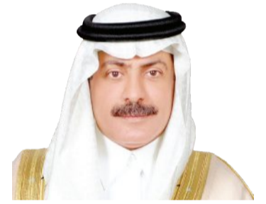
بندر بن عبد الله بن تركي آل سعود