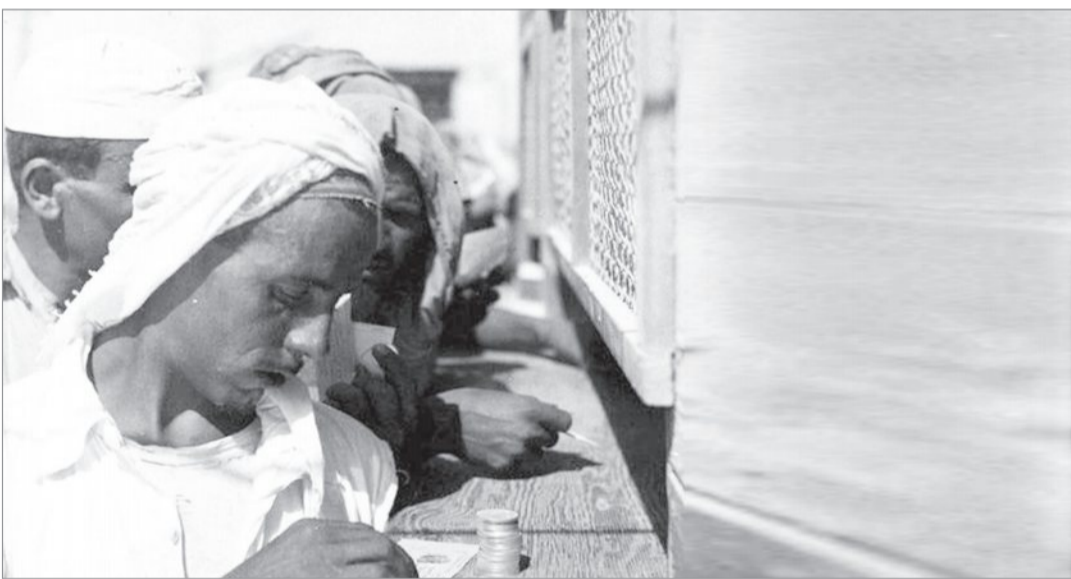
اصطفاا العمال في رحيمة برأس تنورة لاستلام اجرتهم في اواخر الاربعينيات ايضا