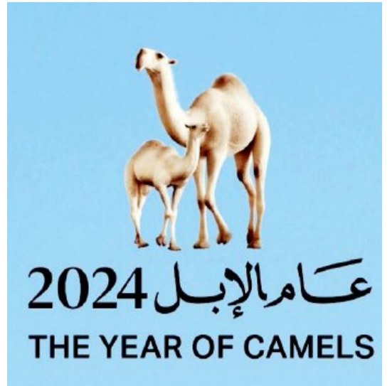
عام الإبل 2024 THE YEAR OF CAMELS