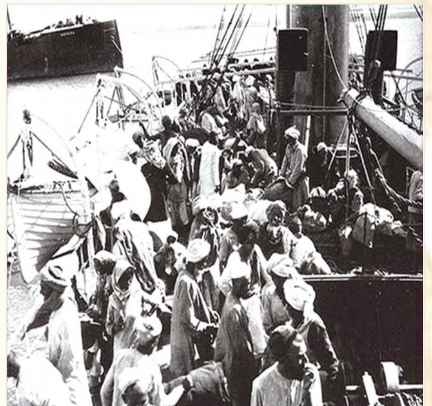
ميناء جدة الإسلامي