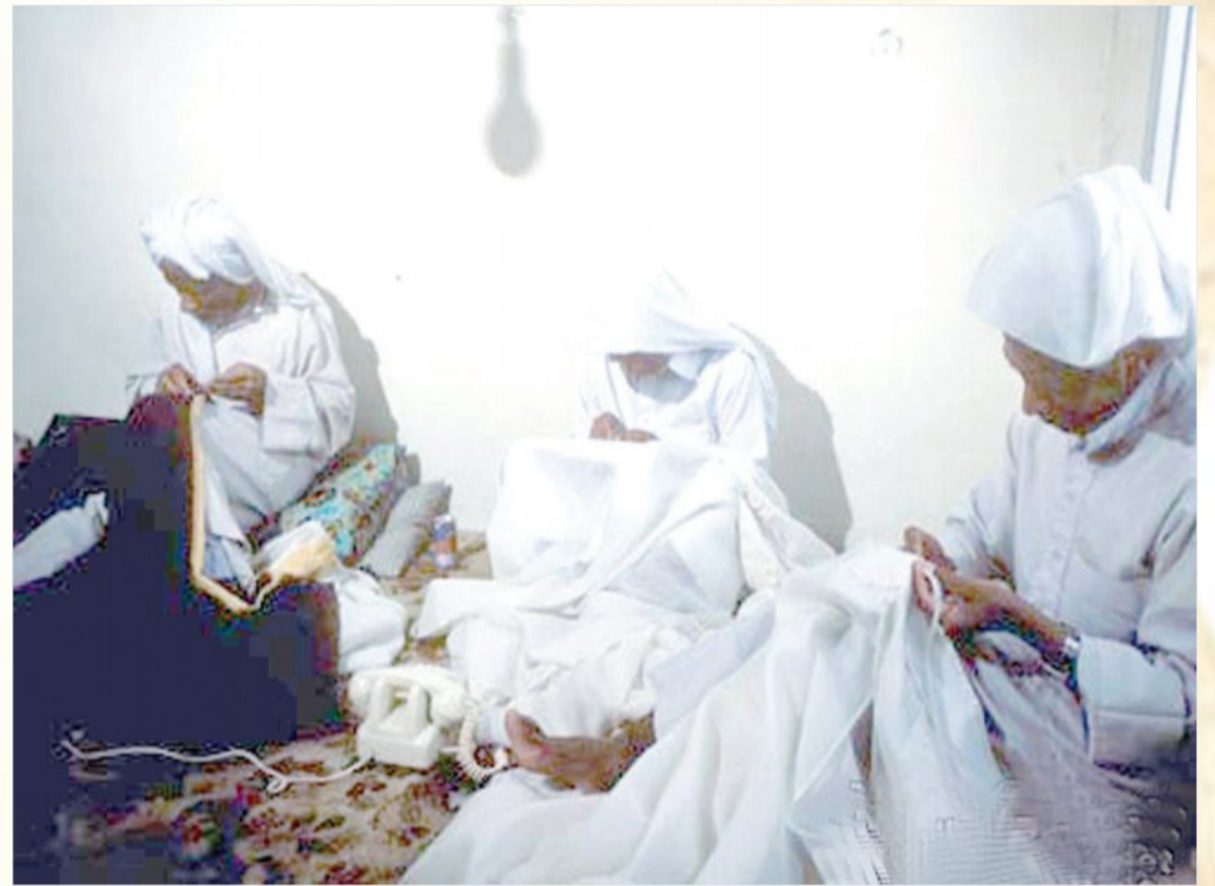
حياكة البشوت - الهفوف الثمانينات