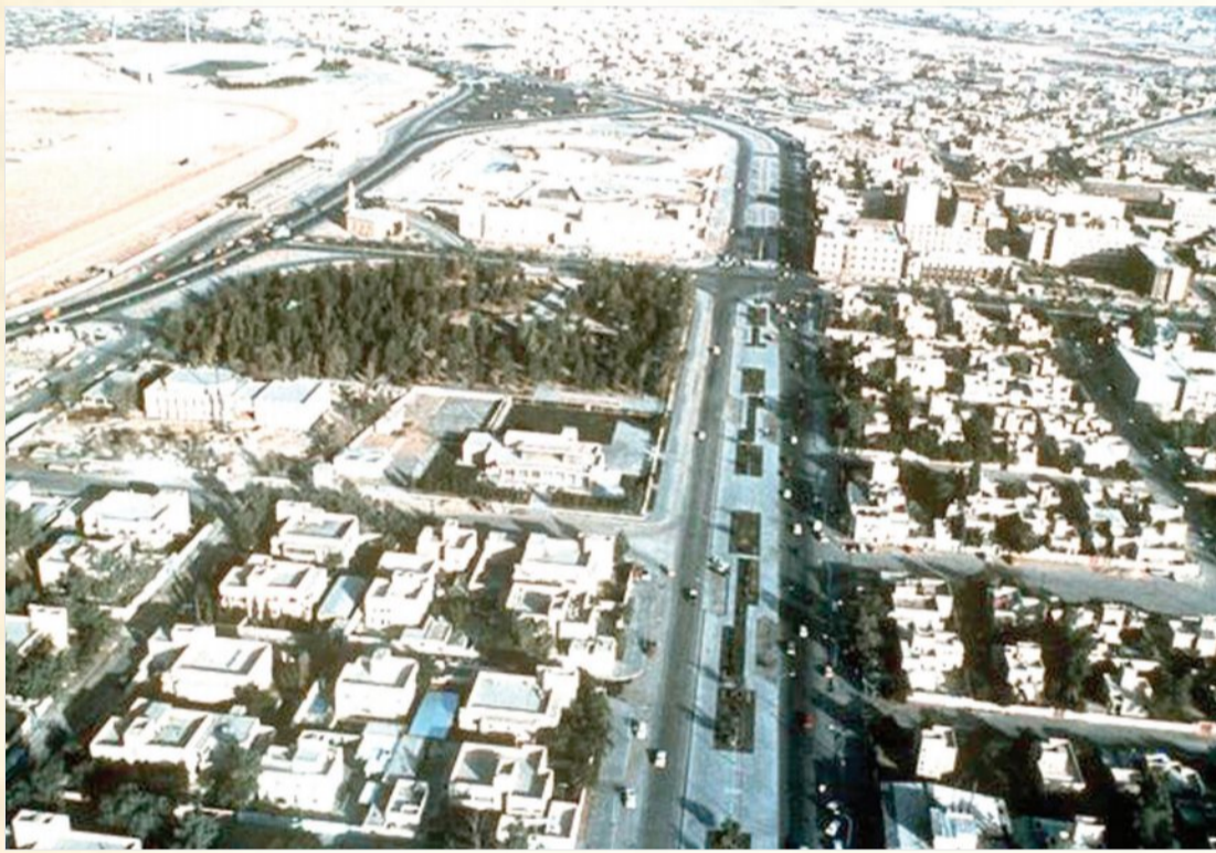
شارع الستين - المزرع الرياض - ١٩٨٠ م