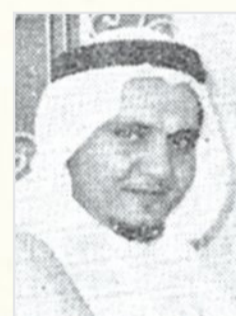
الأمير محمد الفيصل

• السيد احمد حريري.. مدير عام فرع وزارة التجارة والصناعة بالمنطقة الغربية اقبل على عمله بنفس منفتحة.