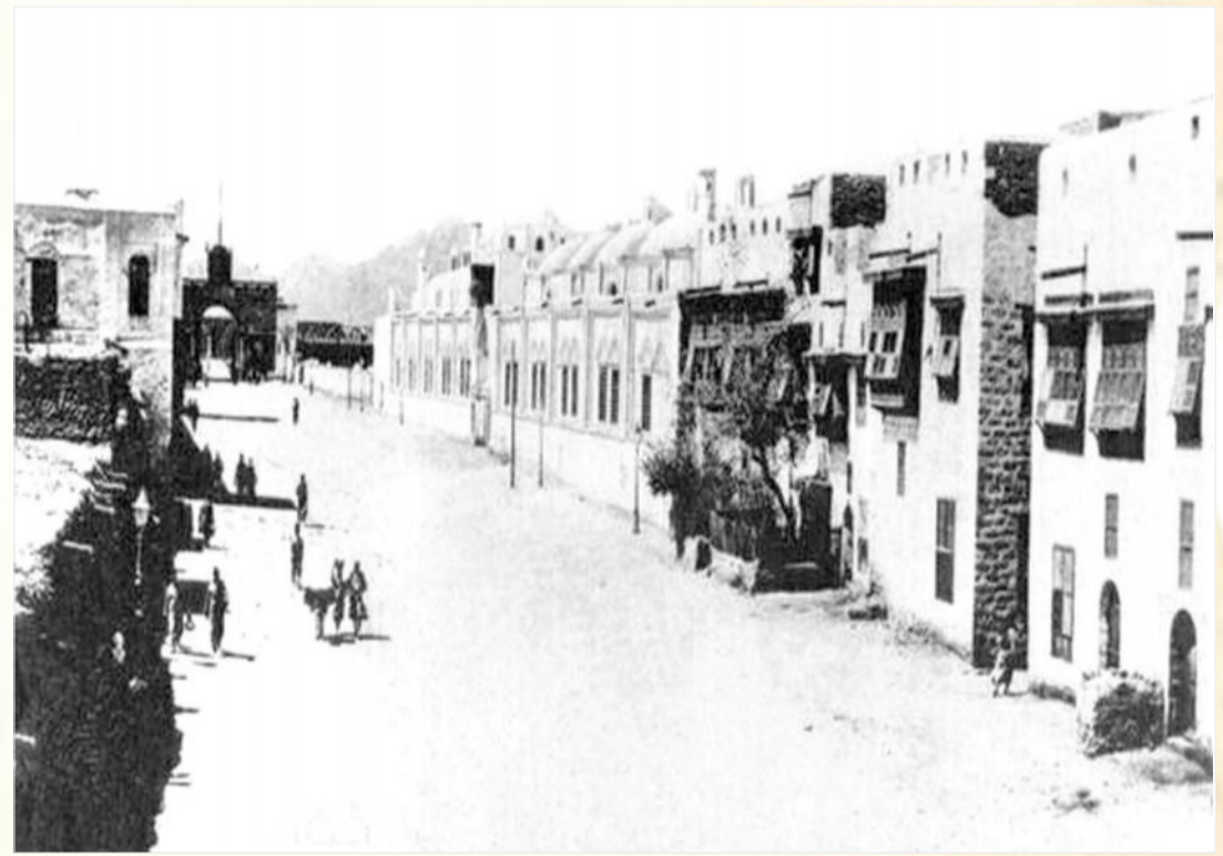
شارع العنبرية - المدينة المنورة