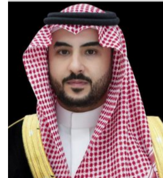
الأمير خالد بن سلمان

وصل صاحب السمو الملكي الأمير خالد بن سلمان بن عبدالعزيز وزير الدفاع، والوفد المرافق له، أمس، العاصمة الإيطالية روما في زيارة رسمية. وتأتي زيارة سموه لاستعراض العلاقات الثنائية وبحث فرص التعاون بين البلدين الصديقين، ومناقشة المسائل ذات الاهتمام المشترك.