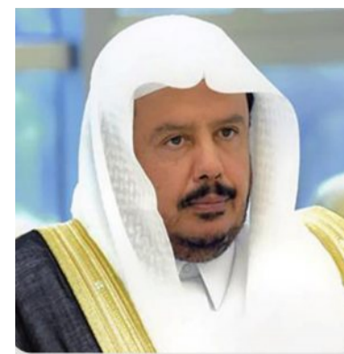
عبدالله آل الشيخ

جاء ذلك خلال الاجتماع الثاني للهيئة أمس، برئاسة معالي نائب رئيس مجلس الشورى الدكتور مشعل بن فهم السلمي، وحضور معالي مساعد رئيس المجلس الدكتور حنان بنت عبد الرحيم الأحمدي، ورؤساء لجان مجلس الشورى المتخصصة، للنظر في الموضوعات المدرجة على جدول أعمالها، وذلك ضمن أعمال السنة الأولى من الدورة التاسعة للمجلس.