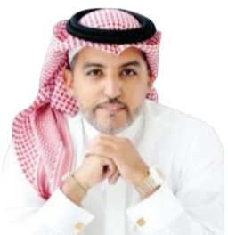
يدر الشيباني @jebadr