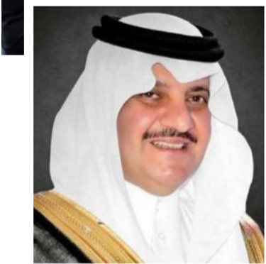
الأمير / سعود بن نايف

وأوضح رئيس مجلس إدارة غرفة الشرقية بدر بن سليمان الريزي، أن المعرض يتيح للباحثين والباحثات عن فرص وظيفية التواصل المباشر مع أصحاب العمل وممثلي المؤسسات، حيث يمكنهم الاستفسار والتعرف على المزيد حول الشركات واحتياجاتها من التخصصات والفرص المتاحة، مبيّناً أن المعرض يعد فرصة للباحثين عن العمل للتعرف على صناعة أو تخصص بشكل أفضل بحيث يمكنهم ذلك من استكشاف الشركات والمؤسسات