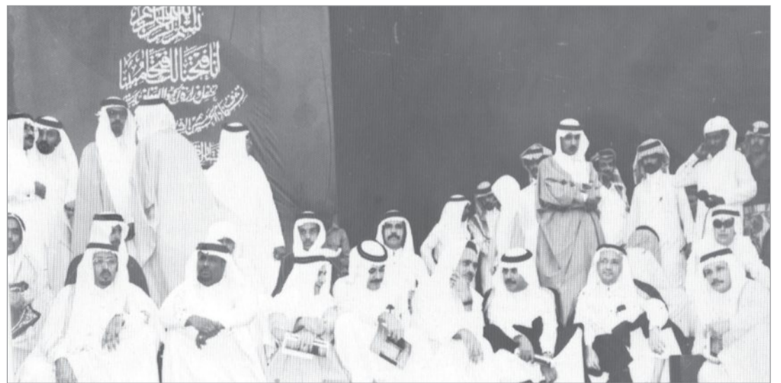
افتتاح باب الكعبة الجديد