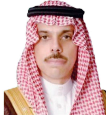
فيصل بن فرحان

استقبل صاحب السمو الأمير فيصل بن فرحان بن عبدالله وزير الخارجية، في مقر الوزارة بالرياض أمس، معالي وزير خارجية جمهورية بوروندي ألبرت شينجيري. وجرى خلال الاستقبال، استعراض علاقات الصداقة والتعاون بين البلدين، وسبل تعزيزها في شتى المجالات، ومناقشة المستجدات على الساحة الدولية والجهود المبذولة بشأنها.