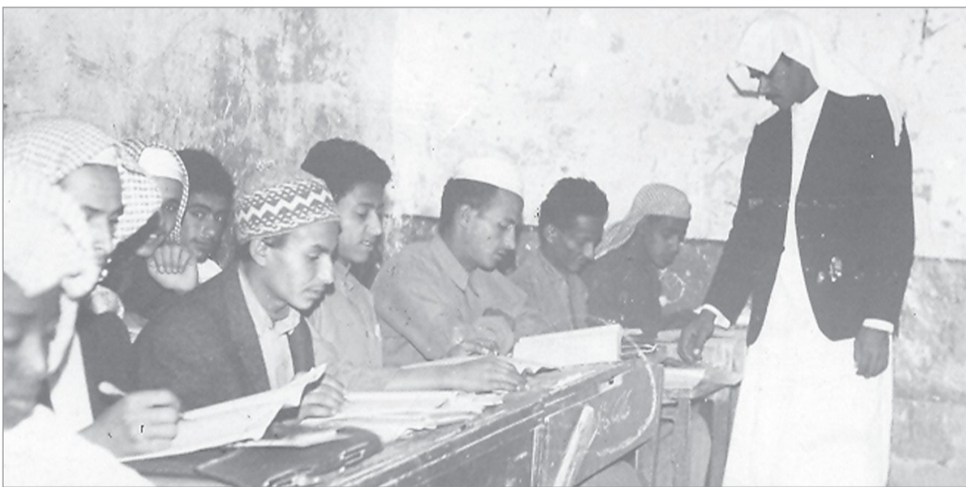
بداية التعليم قبل ٦٠ عاماً