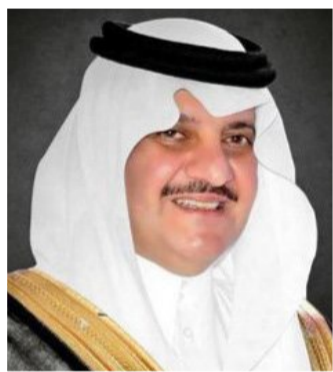
الأمير / سعود بن نايف

المشاركة ومعرفة المزيد عن احتياجات الصناعة والاتجاهات العالمية الحالية، كما يمكن للمشاركين في المعرض تقديم سيرتهم الذاتية إلكترونياً وبشكل مباشر إلى مسؤولي الموارد البشرية. ودعت غرفة الشرقية للباحثين والباحثات عن فرصة وظيفية إلى إكمال عملية التسجيل الإلكتروني في المعرض، حيث يمثل فرصة مميزة لاكتساب المعرفة، وتوسيع الشبكات المهنية، وزيادة فرص الحصول على وظائف ملائمة.