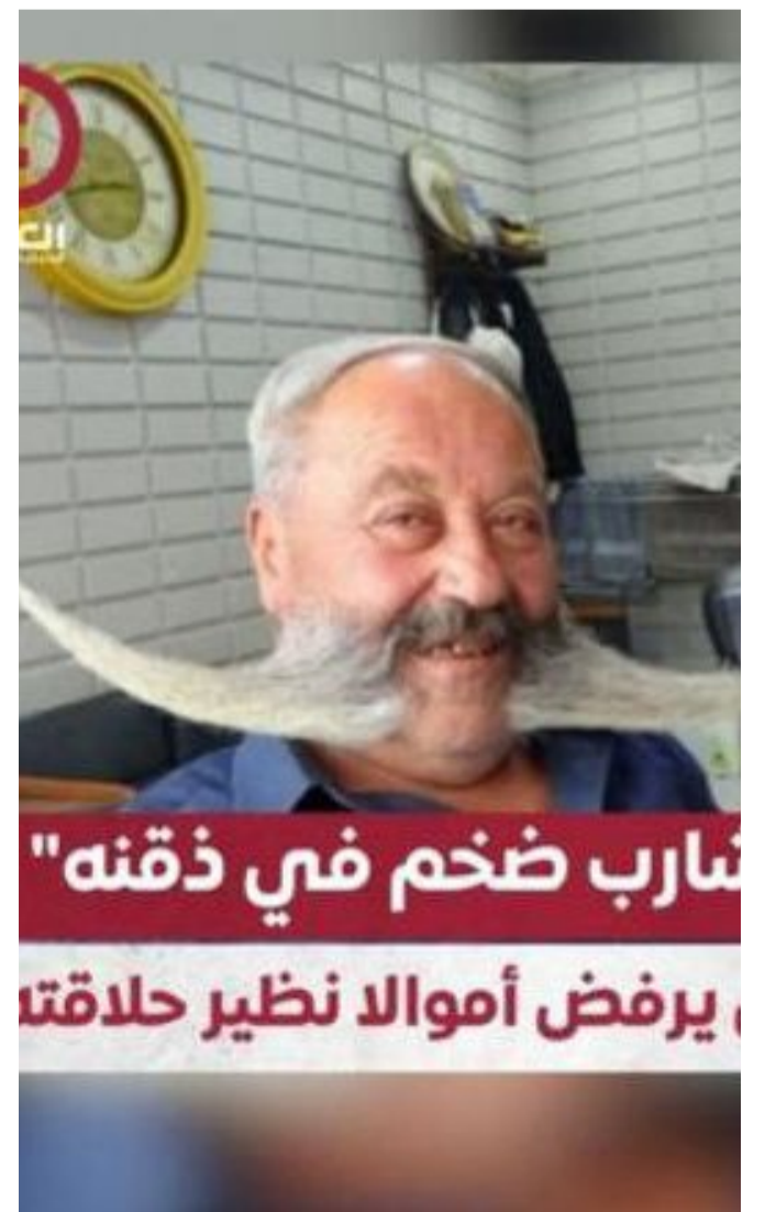
شارب ضخم في ذقنه يرفض أموالا نظير حلاقتة

بينما يتابع الجميع قصته باهتمام، يبقى السؤال: إلى أي مدى يمكن أن يرتبط الشخص بهويته من خلال مظهره؟ بيرم يؤكد أن شاربه ليس مجرد شعر ينمو، بل هو رمز لشخصيته، مما يعكس أهمية القيم والتقاليد في حياتنا اليومية.