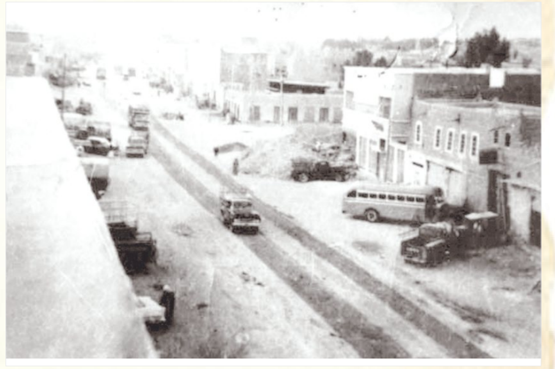
أحد الشوارع بمدينة الرياض

احياء ٢٢ حفلة زواج حيث قد وافانا مندوبونا المتجول ان المحلات الرئيسية اقيم فيها اكثر من حفلة زواج. يزور كلية البترول بالدمام سعادة الدكتور مروان راسم كمال حيث سيصلها قادمًا من عمان.