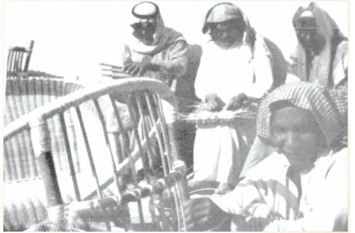
تدريب العميان على اعمال يدوية سهلة على الكراسي