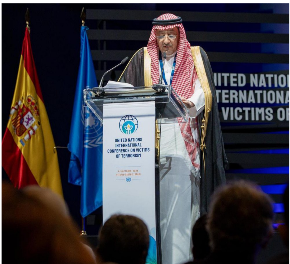
أهمية إحتياك تلك الآلة من جذورها ورواية جميع الضحايا

وفي اليمن، وزع مركز الملك سلمان للإغاثة والأعمال الإنسانية 500 سلة غذائية للأسرة الأكثر احتياجاً بمحافظة عدن، استفاد منها 3.500 فرد، و300 سلة غذائية بمحافظة تعز، استفاد منها 2100 فرد من الفئات الأكثر احتياجاً المتضررة من السيول والأمطار.