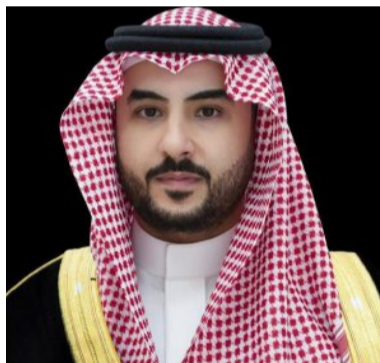
الأمير خالد بن سلمان

أجرى صاحب السمو الملكي الأمير خالد بن سلمان بن عبدالعزيز وزير الدفاع، اتصالاً هاتفياً بمعالي وزير الدفاع الأمريكي لويد أوستن، وجرى خلال الاتصال استعراض العلاقات الاستراتيجية السعودية الأمريكية، وسبل تعزيزها في إطار الشراكة الدفاعية بين البلدين الصديقين، بالإضافة إلى بحث آخر التطورات الإقليمية والدولية، والجهود المبذولة لخفض التصعيد بالمنطقة وتداعياته، بما يضمن أمنها واستقرارها.