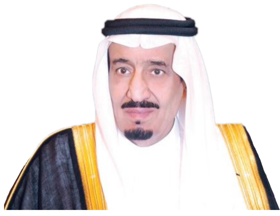
خادم الحرمين يستكمل الفحوصات الطبية ويتماثل للشفاء