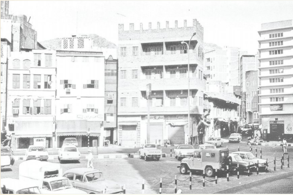
مستشفى ومدخل شارع أجياد