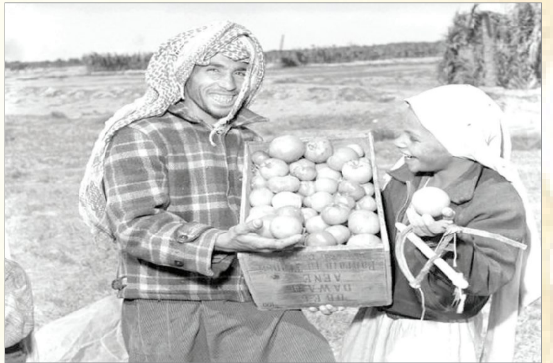
ابتسامه فرح بحصاد (الطماطم) - قطيف - الخمسينيات