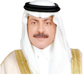
بدر بن عبد الله بن تركي بن عبد العزيز آل سعود

أسس الأول، في اليوم الثالث من ربيع الثاني لعامنا الهجري هذا 1446. اكتمل بفضل الله وتوفيقه وعونه، ثم بجهد قائد مسيرتنا، حادي ركبنا، خادم الحرمين الشريفين، سيدي الوالد المكرم، الملك سلمان بن عبد العزيز آل سعود، حفظه الله ورعاه، وسد على طريق الخير خطاه؛ اكتمل نظم عقد تضيد كامل بالتمام والكمال، من عهد الزاهر الميمون.