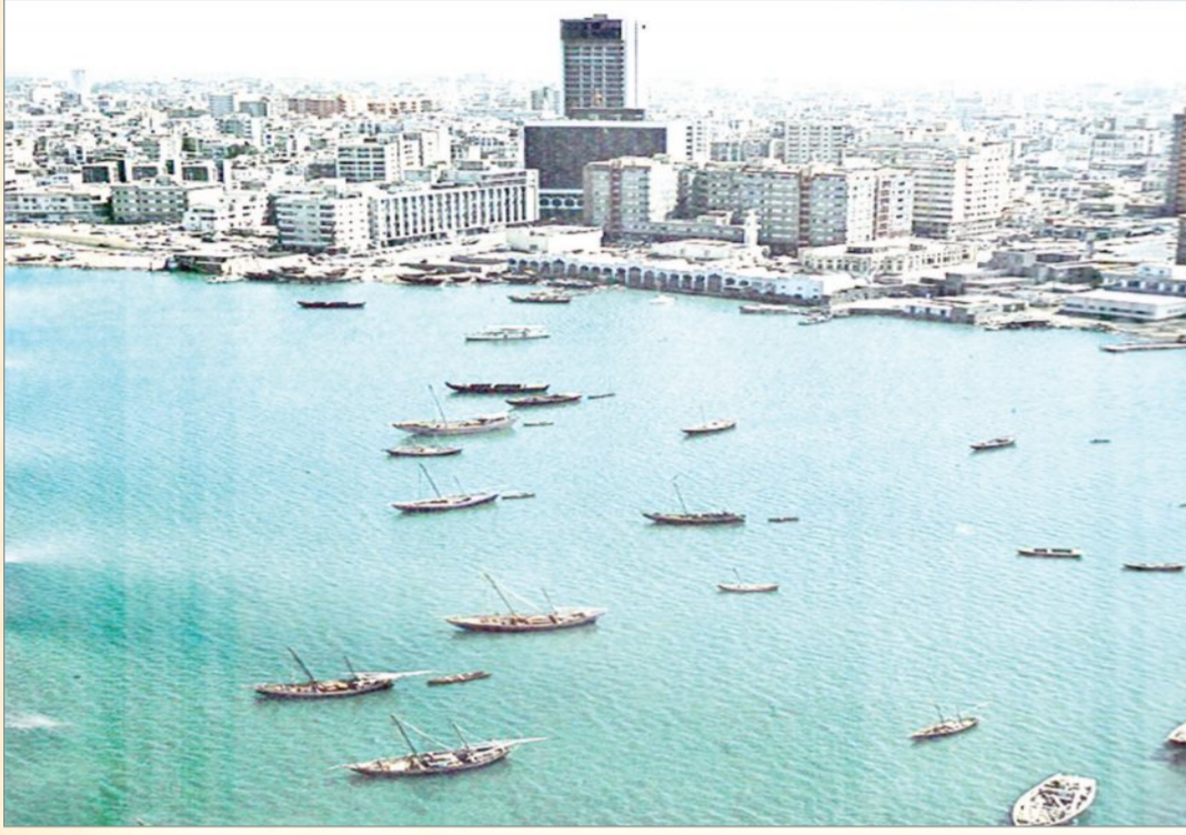
مدينة جدة عروس البحر الأحمر التقطت عام ١٩٧٧