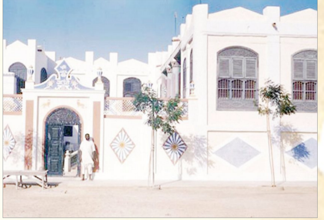
بيت حبشي - لأحد الأثيوبيين جدة ١٩٤٧م