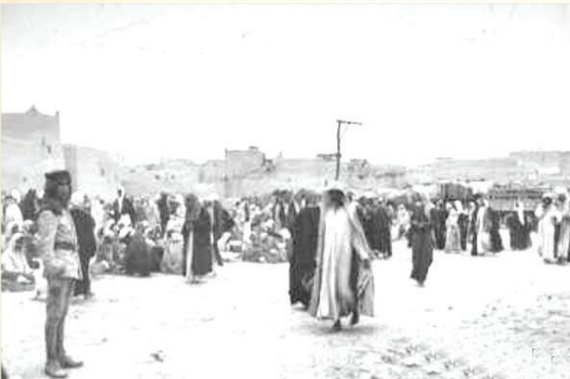
الرياض - ١٩٤٢م