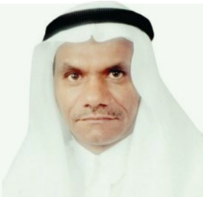
أ.د. سالم سعيد بأعجاجة @drsalem30267810

الالكترونية حكومية رسمية، تتلقى بلاغات المواطنين والمقيمين، وتتحقق من موثوقية التطبيقات، ومدى أمنها، قبل استخدامها من قبل المواطنين والمقيمين.