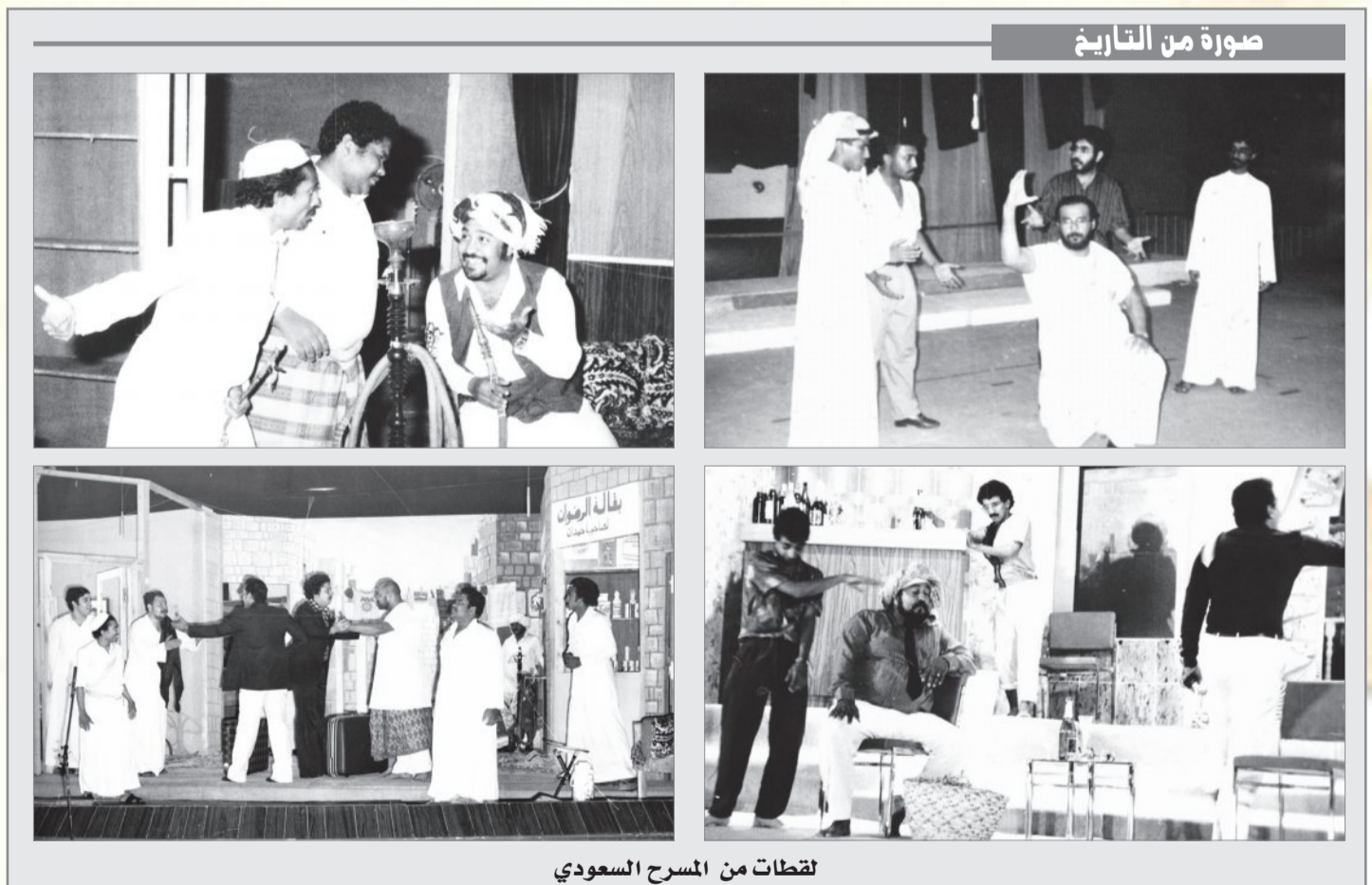
لقطات من المسرح السعودي