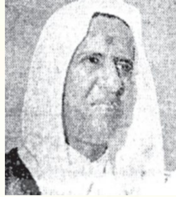
الامير مساعد بن عبد الرحمن

•• اجتمع سعادة الشريف طالب رفيق مدير عام مشروع توسعة الحرم الشريف بحضرة صاحب السمو الامير مساعد بن عبدالرحمن وزير المالية ونائب رئيس اللجنة العليا لمشروع توسعة الحرم الشريف.. وقد بحث في هذا الاجتماع بعض المسائل المتعلقة بالمراحل الاخيرة من مشروع التوسعة.