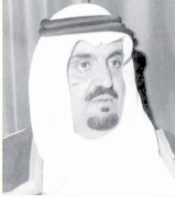
الامير مشعل بن عبدالعزيز

وقد كان على رأس من شهدوا هذا الحفل الكبير حضرة صاحب السمو الملكي الامير مشعل بن عبدالعزيز امير منطقة مكة المكرمة وصاحب المعالي الامين العام لرابطة العالم الاسلامي الشيخ محمد سرور الصبان، ووزير