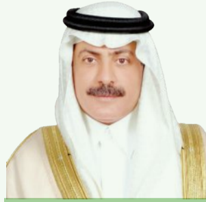
الدكتور الواء بن عبد الله بن تركي آل سعود

بين يمين مع هذا ويسار مع ذاك؛ بل الأسوأ من هذا كله، والأشد مرارة: اندفاع طرف ثالث لخدمة المحتل اليهودي لأراضيهم، ودونكم كثير من الأفلام الوثائقية التي تؤكد هذا. والنتيجة: ما نراه اليوم من معاناة مؤلمة لكثير من الأبرياء من الأشقاء الفلسطينيين في غزة والضفة على حد سواء، بل امتد الأذى ليطال أولئك الذين في المخيمات أيضاً. ولما كانت القضية الفلسطينية هي قضية السعودية الأولى، كما يؤكد قائدنا الكرام البررة على الدوام، كان بدهياً أن تحظى بوقت أطول من دبلوماسيتها النشطة الفعالة، لها هو الراحل الكبير الأمير سعود الفيصل، عميد السلك الدبلوماسي السعودي العربي، الذي كان أحد أهم الوجوه السياسية الدبلوماسية في العصر الحديث، وله جهود كثيرة مذكورة مشكورة من أجل تحقيق السلام في العالم أجمع، حظيت بتقدير كبير من أعظم زعماء العالم، يسير على نهج المؤسس ووالده الفيصل، فيحمل لواء المنافحة عن فلسطين الشقيقة في كل المحافل الدولية، حتى عندما أتركه المرض وهو يتوكل على عصاه محتاملاً على نفسه من أجل أداء رسالة بلاده؛ إذ لم يكن للدبلوماسية السعودية أن تتخلى ولو يوماً واحداً عن التأكيد على حق الفلسطينيين في استعادة أراضيهم المغتصبة وتأسيس دولتهم. وتجدر الإشارة هنا إلى دور الدبلوماسية السعودية بقيادة سعود الفيصل، من أجل دعم القضية الفلسطينية في اتفاق مكة المكرمة، الذي كان أحد مهندسيه المبدعين، ومبادرة السلام العربية؛ إضافة لجهوده الدبلوماسية المتميزة في كثير من الأحداث الساخنة الجسيمة، التي كان لها تأثير كبير على المنطقة والعالم أجمع، كمؤتمر الطائف الذي كان عرابه، ومهندسه الأبرز، الذي أفضى في النهاية، إلى وضع حد للحرب اللبنانية الأهلية، التي ما تزال