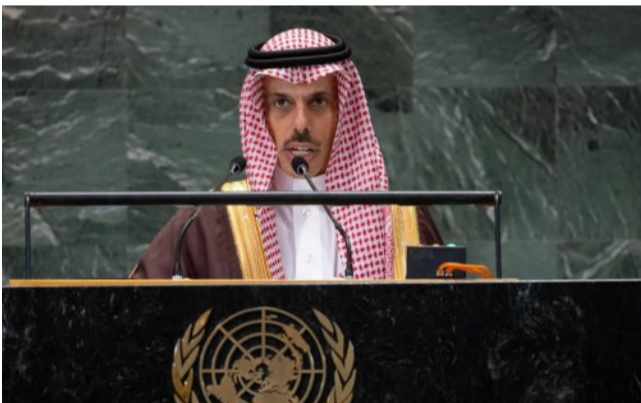
المملكة تتطلع لاستضافة مؤتمر مكافحة التصحر القادم الأمن والاستقرار أساس التعاون لتحقيق التنمية في العالم

ضم وفد المملكة كل من صاحبة السمو الملكي الأميرة ريماء بنت بندر بن سلطان بن عبدالعزيز سفيرة خادم الحرمين الشريفين لدى الولايات المتحدة الأمريكية، ومعالي وزير الاتصالات وتقنية المعلومات المهندس عبدالله بن عامر السواحه، ومعالي وزير الاقتصاد والتخطيط الأستاذ فيصل بن فاضل الإبراهيم، ووكيل وزارة الخارجية للشؤون الدولية المخرمة والمشرف العام على وكالة الوزارة لشؤون البلموماسية العامة الدكتور عبدالرحمن الرسي، ومندوب المملكة الدائم لدى الأمم المتحدة في نيويورك السفير الدكتور عبدالعزيز الواصل، ومدير عام مكتب سمو وزير الخارجية عبد الرحمن الداود.