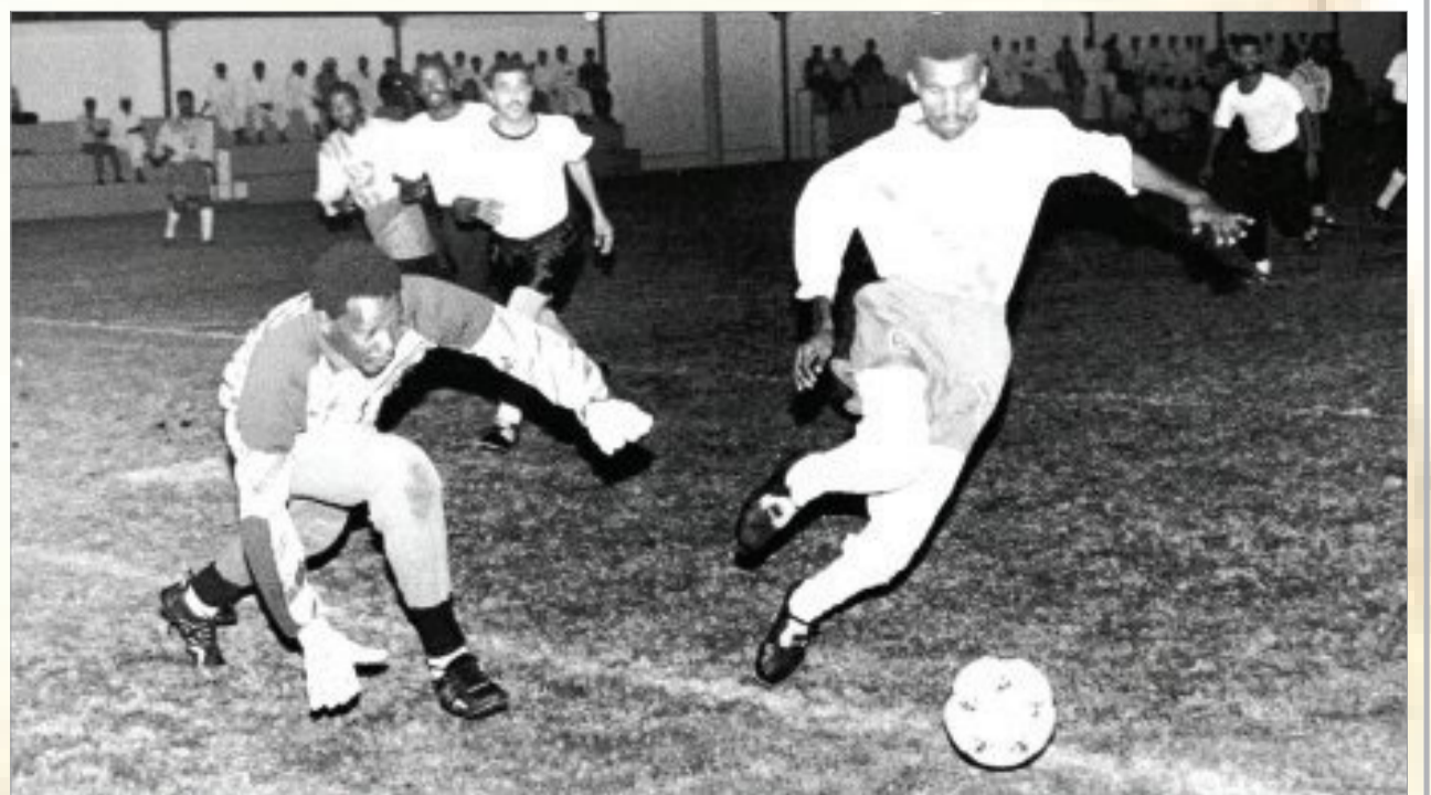
دوري الحواري بالمنطقة الغربية