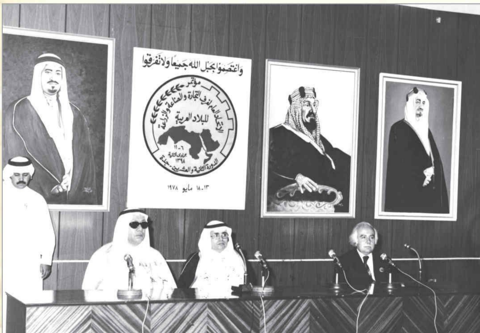
اجتماع الاتحاد العام لـ (غرف التجارة والصناعة والزراعة للبلاد العربية)