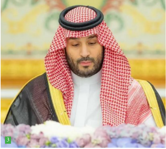
تسمية عام 2025م بـ "عام الحرف اليدوية"