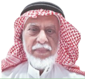
عبد العزيز التميمي

الشفعية، ونجح في تسجيل مئات الساعات من المقابلات الشفعية مع المستن من رواة البلدية، وجمع كل ما يتعلق بحياتنا البادية من أشعار وقصص وأنساب ووسوم وديار وموارد وتاريخ شفهي. وبين الأعوام 1991 - 2001، رأس الدكتور الصويان مشروعاً لتوثيق سيرة الملك عبد العزيز آل سعود في الوثائق الأجنبية، والتي صدرت في 20 مجلداً ضخماً، يقع كل منها في حدود 700 صفحة تحتوي على ملخصات عربية وافية لما لا يقل عن 50 ألف وثيقة، من الأرشيفات الأجنبية، كما تولى الإشراف على مشروع توثيق الثقافة التقليدية في المملكة العربية السعودية، وصدرت في 12 مجلداً يقع كل منها في حدود 500 صفحة، تستوعب كافة جوانب الثقافة التقليدية. وقد أصدر الدكتور سعد الصويان، العديد المؤلفات في الأنثروبولوجيا ودراسة الشعر النبطي، ومن أبرزها كتابه «الصحرار العربية: ثقافتها وشعرها عبر العصور: قراءة أنثروبولوجية»، وكتاب «ملحة التطور البشري، الذي منحه من خلاله جائزة الشيخ زايد آل نهيان للكتاب فرع التنمية وبناء الدولة في الدورة الثامنة عام 2014م. كما منحه جائزة أمين مدني للبحث في تاريخ الجزيرة العربية في دورتها السادسة عام 2017م/1438هـ بمناسبة منحه جائزة أمين مدني للبحث في حياتنا الثقافية، له وقع خاص، أنه مرافق للأمانة العلمية، والعمل الميداني الجاد، والمثابرة المستمرة. وسنظل كتبه، تثري الفكر، وتثري الطريق أمام الباحثين مزيد من البحث والدراسة والتعليق الميداني .