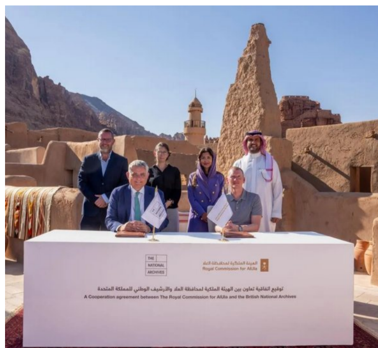
والمساعدة على جمع وحفظ المستندات والصور والفيديوهات من أهالي العلا؛ لتوفير نافذة على تاريخ العلا والإنسان.

وقعت الهيئة الملكية لمحافظة العلا، شراكة مع الأرشيف الوطني البريطاني؛ بهدف تعزيز التعاون ومشاركة الأبحاث المشتركة في مختلف المجالات ذات العلاقة لتطوير الأبحاث والأرشيف، وفقاً لرؤية العلا المتماشية مع رؤية الملكة 2030. ويشمل نطاق عمل الاتفاقية 5 مجالات رئيسية، وهي: التدريب والتبادل العلمي، ورقمنة المجموعات الأرشيفية ونشرها، وتطوير المعارض والفعاليات، وبرنامج البحث في المحتوى الأرشيفي، بالإضافة إلى التعاون في مجال الرقمنة، مستعيناً بخبرة الأرشيف البريطاني. وتتضمن الشراكة مجموعة من المبادرات، التي تركز على مشاريع البحث المشتركة، ومبادرات الأرشيف الرقمية والمعارض الثقافية،