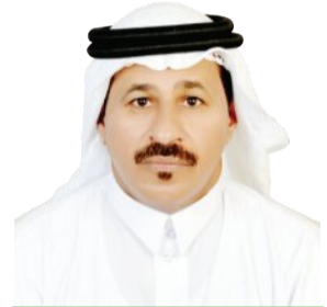
محمد لويضي الجهني @Leafed

إستبشر أهالي منطقة تبوك فرحاً، وبسعادة غامرة وعامة وشاملة، إكتظت بها كل وسائل التواصل، والمجالس، والأسر الكريمة، وذلك بمناسبة صدور الأمر الملكي الكريم بتمديد خدمة أمير المنطقة المحبوب للمهم صاحب السمو الملكي الأمير فهد بن سلطان بن عبدالعزيز آل سعود (حفظه الله ورحاه) لمدة أربع سنوات قادمة، لمواصلة العطاء والتميز والإبداع للمنطقة، والتي خطت خطوات كبيرة متألقة ورائدة وغير مسبوقه في كافة المجالات، حتى أصبحت منطقة تبوك أسرع مناطق المملكة نمواً وتنمية ونظوراً واتساعاً وازدهاراً وتنظيماً في كافة المجالات. كل ذلك حدث بتوجيهات ومتابعة المحب للمنطقة والمحبيب من أهلها والمحفز والداعم والمهندس المبدع والمخلص والمتابع كل التفاصيل لكل ما يحدث حتى تحولت من منطقة حدودية بتكوينات جغرافية وتضاريس مختلفة، الي أجمل المناطق حضارياً وسياسياً واقتصادياً وسلّة للغذاء بمزارعها المتنوعة والشاملة بإنتاج كثير وجودة عالية