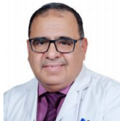
د. صالح هاشم الشري @SalehElshehry

المبيض مصنع ضخم تنمو فيه البويضات، وغالباً ما يكون نشيطاً في توليد الخلايا، والسرطان هو خلايا شديدة النشاط لدرجة أن يصبح نشاطها في التكاثر غير قابل الإنضباط، ولذا فإن توقف المبيض عن العمل، يقلل من احتمالات السرطان، يقل سرطان المبيض مع تعاطي موانع الحمل التي توقف الإباضة مثل الوسائل ثنائية الهرمون، ومنها ما يكون على شكل حبوب يتم تعاطيها عن طريق الفم، أو لصقات جلدية، أو حلقات مهبلية، كذلك الحمل والرضاعة، يقلل من احتمال تعرض المرأة بسرطان المبيض. معظم المراجعات الطبية، توصي أيضاً باستئصال أنابيب الرحم بدلاً من ربطها عند السيدات اللواتي يحتجن لهذه الطريقة كمنع للحمل، وكذلك يوصي باستئصال الأنابيب جراحياً إذا كانت هناك حاجة لإستئصال الرحم، والسبب وجود مؤشرات على أن سرطان المبيض ينشأ أصلاً من الأنابيب.