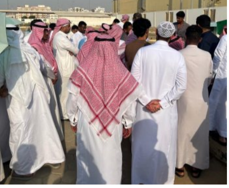
المحمدي بجوار مسجد الحمد، واليوم الخميس هو آخر أيام العزاء. "إننا لله وإنا إليه راجعون".