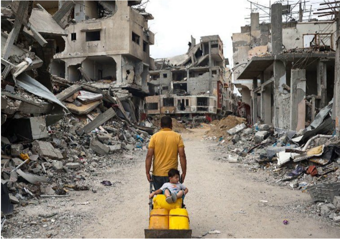
حكومة الاحتلال في ظل صمت المجتمع الدولي. ووجهت نداءاتها إلى وسائل الإعلام العربية والدولية

البلاد - واس نفذ مستوطنون، سلسلة اعتداءات على الفلسطينيين في قرى رام الله والخليل بالضفة الغربية، مما أدى لإصابة العديد من الفلسطينيين بجروح، وإحراق مساحات واسعة من الأراضي الزراعية. وأفاد الهلال الأحمر الفلسطيني، بإصابة خمسة فلسطينيين برصاص بحماية من قوات الاحتلال الإسرائيلي على قرية المغير شمال شرق مدينة رام الله، وقد أطلقت قوات الاحتلال الإسرائيلي الرصاص والقنابل الغازية المسيلة للدموع لحظة اقتحام المستوطنين للخطية على هجومهم على أهالي قرية المغير. وفي سياق متصل، أحرق مستوطنون مساحات واسعة من أشجار الزيتون في بلدة صوريف بمدينة الخليل، وذلك في إطار الاعتداءات المستمرة على الفلسطينيين لتوسيع المستوطنات في الضفة الغربية، والتي شهدت إقامة 35 بؤرة استيطانية خلال العام الجاري. واستشهد 15 فلسطينياً وأصيب العشرات بجروح، في قصف لقوات الاحتلال الإسرائيلية استهدف مدرسة "حمامة"، التي توّو نازحين في حي الشيخ رضوان غرب مدينة غزة. وأفادت مصادر طبية فلسطينية في المستشفى الأهلي العربي بمدينة غزة، أن الطواقم الطبية انتشلت 15 شهيداً وعشرات الجرحى، معظمهم من الأطفال والنساء، كانوا بداخل المدرسة، التي قصفتها طائرات الاحتلال، لافتة النظر إلى أن قوات الاحتلال لم تكف بقصف الفصول الدراسية التي بداخلها المئات من النازحين الذين هدمت منازلهم، بل عاودت قصف الطواقم الطبية وفرق الدفاع المدني أثناء انتشالها للشهداء والجرحى في باحات المدرسة، مما أدى لارتفاع حصيلة الشهداء والجرحى. وفي السياق ذاته، استشهد أربعة فلسطينيين في قصف جوي بطائرات حربية إسرائيلية استهدفت مركبتين في بلدتي بلعا وزيتا شرق مدينة طولكرم بالضفة الغربية. وأفادت مصادر طبية فلسطينية،