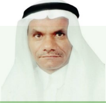
أ.د. سالم سعيد باعجاجه @drsalem30267810

البلاد، وتصرف هذه الأموال في الخارج للسكن والإقامة والأكل والشرب والترفيه، بدلاً من صرفها في الداخل، لأن البقاء في أرض الوطن والسياحة في داخل المملكة يجعلنا نصرف أموالنا في داخل بلادنا. لذا نهب بوزارة السياحة وكذلك وزارة التجارة مراقبة أسعار الفنادق والمنتجعات السياحية، والشقق المفروشة، ووضع تسعيرة منصفة عادلة، بحسب درجات الفنادق والمنتجعات السياحية، حتى يستطيع المواطنون تقبّل هذه الأسعار.