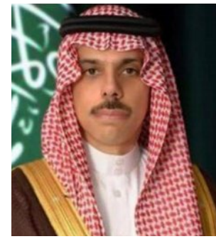
الأمير فيصل بن فرحان

وعبر سموه خلال الاتصال عن دعم المملكة لكافة الجهود الرامية إلى الوقف الفوري لإطلاق النار، والانسحاب الكامل لقوات الاحتلال الإسرائيلي، وتقديم المساعدات