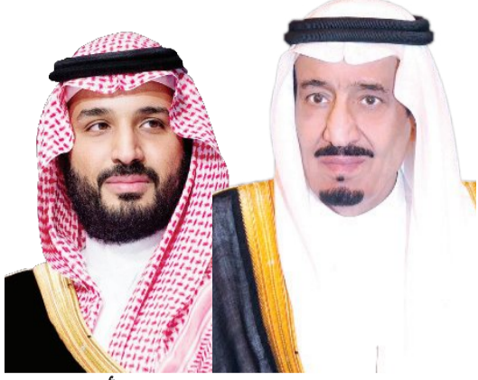
القيادة تهنئ ملك الأردن ورئيسي الأرجنتين وزامبيا