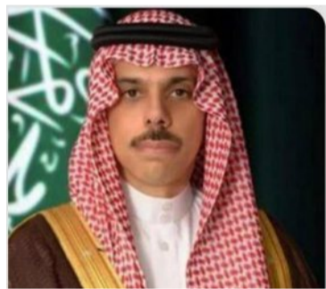
الأمير فيصل بن فرحان

خلال اللقاء، العلاقات السعودية الفرنسية وسبل تعزيزها في شتى المجالات، بالإضافة إلى مناقشة تكثيف التنسيق الثنائي في العديد من القضايا ذات الاهتمام المشترك. كما ناقشنا تطورات الأوضاع في قطاع غزة ومحيطها والجهود المبذولة بشأنها، وأهمية