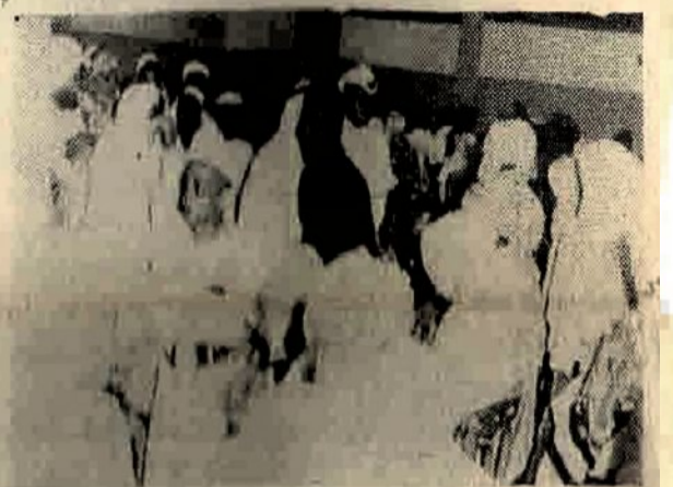
إحدى الصور المجموعة من الحجاج المالىزين في مطار جدة والرسالة

وصلت ميناء جدة أول امس الباشرة كوالايلور تحمل الفوج الاول من الحجاج المالىزين وعددهم ١٠٤٩ حاجا . كما قدمت على نفس الباشرة البعثة العلمية الزيرية وعسى مكونة من ٢٨ عضوا .