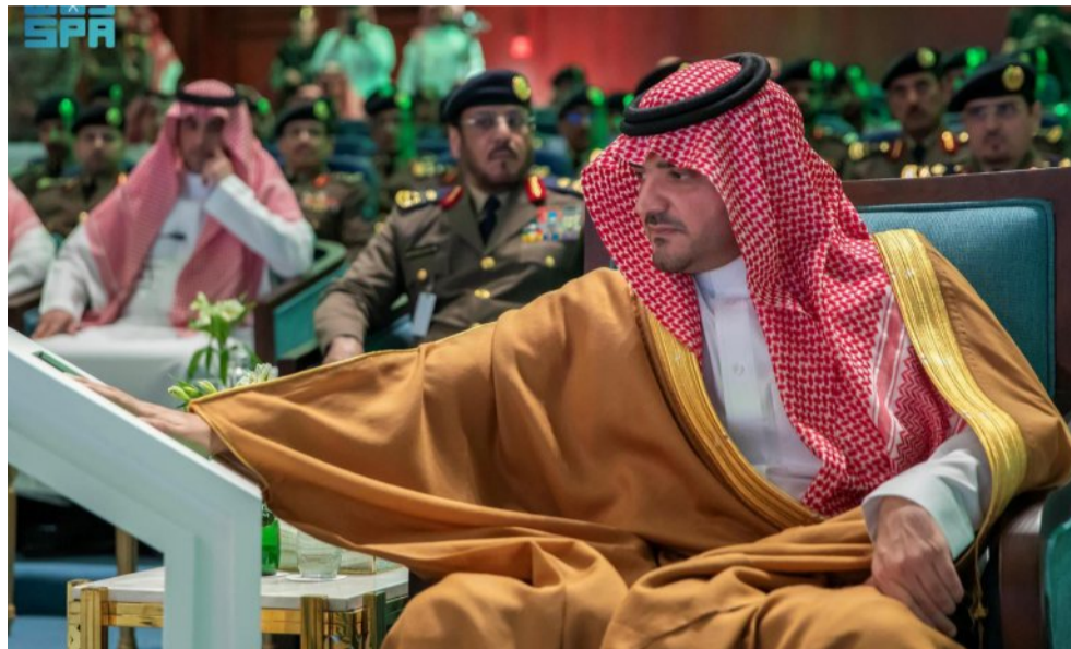
التي تقدمها بوابة سلامة من خلال منصة أبشر أعمال 34 خدمة. وكان سموه قد استعرض عدداً من الآليات الحديثة، والفرق المتخصصة في أعمال الدفاع المدني؛ وفق أحدث التجهيزات

الغنية العالمية والخدمات التقنية الحديثة، واستمع إلى شرح موجز قدمه مدير عام الدفاع المدني المكلف اللواء الدكتور حمود بن سليمان الفرج عن الجهود التي نفذتها المديرية خلال العام 2023م، والمستهدفات للعام 2024-2025م. حضر الحفل، صاحب السمو الأمير الدكتور بندر بن عبدالله بن مشاري مساعد وزير الداخلية لشؤون التقنية، ومعالي عضو هيئة كبار العلماء عضو اللجنة الدائمة للإفتاء فضيلة الشيخ الدكتور عبدالسلام بن عبدالله السليمان، ومعالي مساعد وزير الداخلية لشؤون العمليات الفريق أول سعيد بن عبدالله القحطاني، ومعالي مساعد وزير الداخلية الدكتور هشام بن عبدالرحمن الفالح، ومعالي وكيل وزارة الداخلية الدكتور خالد بن محمد البتال، ومعالي مدير الأمن العام الفريق محمد بن عبدالله البسامي، وقادة القطاعات الأمنية.