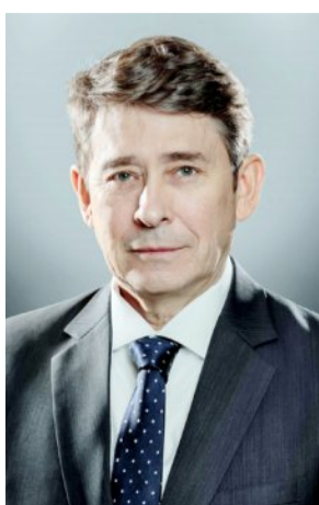
السيد توني كرييس

في إنجاز يعكس تفرد المستثمر في القطاع المصرفي توج البنك السعودي الأول بجائزة "أفضل بنك في المملكة لعام 2024" والمقدمة من قبل مجلة "غلوبال فاينانس" وذلك للمرة الخامسة على التوالي تقديراً لتمييزه في تقديم تجارب مصرفية مبتكرة وتكريماً للجهود المتواصلة التي يقدمها "الأول" في خدمة