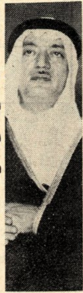
... أوبورتو :

السقاف وكيل وزارة الخارجية وكانت المباحثات بين الجانبين قد بدأت في مقر وزارة الخارجية المغربية يوم الخميس الماضي وتواصلت لليونانيات بريس ان سعادة السيد السقاف سيعود الى الرباط يوم الاثنين غدا حيث يقابل جلالة الملك الحسن الثاني عاهل المغرب