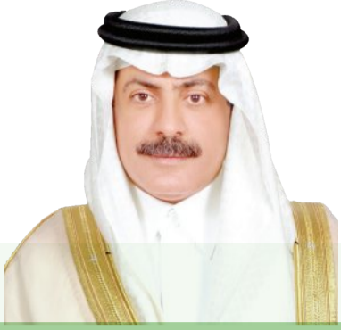
اللواء ركن (متقاعد) الدكتور