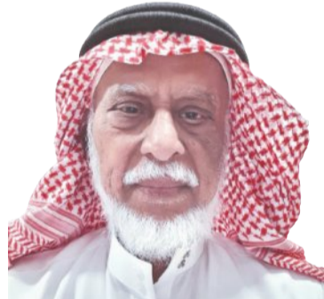
عبد العزيز التميمي

أنيس منصور دراسته الثانوية في مدينة المنصورة، حيث كان الأول على كل طلبة مصر. ثم التحق بكلية الآداب جامعة القاهرة، ودخل قسم الفلسفة وحصل على ليسانس الآداب عام 1947، وعمل لفترة أستاذاً في قسم الفلسفة بجامعة عين شمس، ثم تفرغ للكتابة والعمل الصحفي. وعن بداياته الصحفية، يقول إنه دخل الصحافة بالمصادفة، وكان كل طموحه أن يجد فرصته للعمل في إحدى الهيئات الدولية، غير أن وفاة والده فجأة، دفعته إلى الحياة العملية، فاندفع. نصح الدكتور عبدالوهاب عزام، عميد كلية الآداب في ذلك الوقت، بالعمل في الصحافة، وعرض عليه أحد أصدقائه أن يكتب القصص في صفحة الأدب، وهكذا دخل الصحافة من باب الأدب، وظل يقول إنه يعتبر نفسه أديباً يعمل في الصحافة، ويقول أنا لست مخبراً صحفياً، وكانت الصحافة ومخبراً له يعيش بين عمالقة الفكر والصحافة ورموز الأدب ومشاهير الفن وأجيال شتى من المبدعين على اختلاف معارفهم ووسط