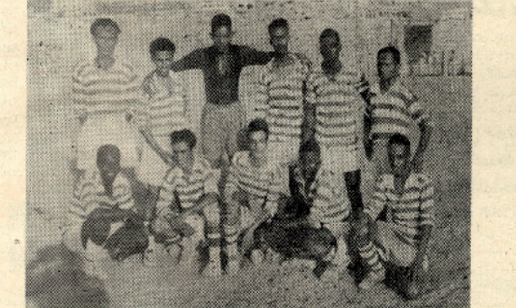
فريق النصر في احدي مبارياته امام فريق زهزم يوم ١٣-٢-١٣٧٩ هـ . والمعروف ان « النصر » احد فرق الدرجة الاولى في مكة المكرمة - وقد « انحل » قبل عامين من الآن .