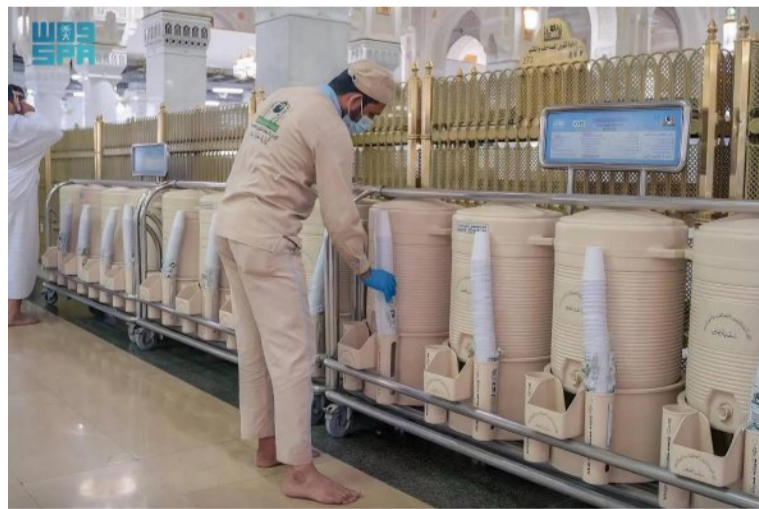
مختبرات الهيئة المختصة لتحليل مياه زمزم كيميائياً وبكتريولوجياً قبل استعمالها من قبل

مرتادي بيت الله الحرام، وذلك للكشف عن أي ملوثات كيميائية أو بكتريولوجية وتشترط الهيئة توفر شهادات صحية لجميع العاملين في السقيا، وذلك للتأكد من خلوهم من الأمراض المعدية ونظافة القواعد التي توضع عليها الحافظات بصفة مستمرة بإشراف الإدارة وتعبئة الحافظات وتوزيعها في أرجاء المسجد الحرام والمساحات بعد التأكد من نظافتها وتبديل الكاسات المستعملة ووضع كاسات بلاستيكية جديدة بدلاً منها وصيانة ونظافة الخزانات حسب جدولية أسبوعية شهرية وموسمية تنظم وفق الخطة المتبعة، وبأفضل الأساليب والوسائل المطلوبة. وتتولى إدارة سقيا زمزم بالمسجد الحرام