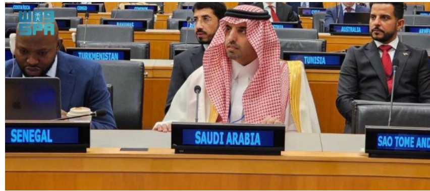
عبدالعزیز بن محمد الواصل، معالي محافظ الهيئة الوطنية للأمن السيبراني المهندس ماجد بن محمد المزید، ورأس وفد المملكة المشارك في الاجتماع

شاركت المملكة ممثلة بالهيئة الوطنية للأمن السيبراني في الاجتماع الدولي رفيع المستوى في الأمم المتحدة حول "بناء القدرات في مجال أمن تكنولوجيا المعلومات والاتصالات" الذي عقده الفريق العامل مفتوح العضوية المعني بأمن تكنولوجيا المعلومات والاتصالات واستخدامها الآمن، وذلك بمشاركة الوزراء المسؤولين عن أمن تكنولوجيا المعلومات والاتصالات للدول الأعضاء في الأمم المتحدة، ومندوب المملكة الدائم لدى الأمم المتحدة في نيويورك السفير الدكتور