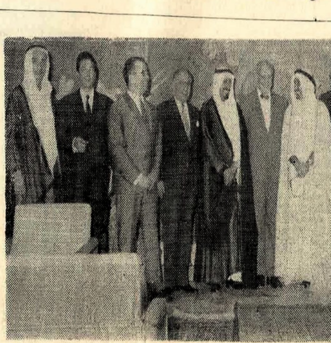
معالي وزير الاعلام الاستاذ جميل الججيلان يتوسط اعضاء الوفد الصحفي اليوناني ويرى في وسط الصورة ايضا الشاعر اللبناني الكبير الاستاذ امين نخلة ونخبة من رجال الاعلام .

في مأدبة معالي وزير الاعلام التي اقامها للوفد الصحفي اليوناني - امس - التقى شاعرنا الكبير الاستاذ فؤاد شاکر بصديقه الشاعر اللبناني المعروف الاستاذ امين نخله ، وقد أوجت المناسبة للاستاذ فؤاد شاکر ، بالابيات التالية التي ارتجلها ، والقها في نهاية المأدبة ، وقد قوبلت من الوفد اليوناني ، ومن الحاضرين بالتقدير والاعجاب ، كما ترجمت معانيها الى اللغة اليونانية ، وهذه هي : يسوم من الفصحى ميمین هو « نخلة » للروض وهو وبه التقى اليونان وهي عهد من التاريخ اشر فيه تجلت حكمة الدنيا هي حكمة يزهي بها التا عرفت « اثينا » عهدا هي للثقافة منهل