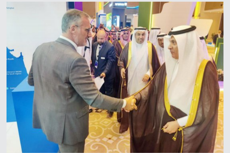
خلال مشاركتها في أعمال منتدى المياه السعودي الثالث

وينطوي هذا المشروع المشترك الأول من نوعه على استيراد المنتجات بشكل مباشر والتصنيع المحلي الكلي والجزئي على مراحل، في ظلّ الالتزام بجدول زمني واضح للتحوّل التدريجي الكامل نحو سلاسل التوريد المحلية في المملكة، بما يسهم في إيجاد عدد ملحوظ من فرص العمل الجديدة للمواطنين السعوديين. وسوف تقوم شركة "سقالة للرعاية الصحية" من خلال نزعها الصناعي "ألفا فارما" بتقييم استراتيجيات توفير المنتجات ذات الإمكانات العالية داخل