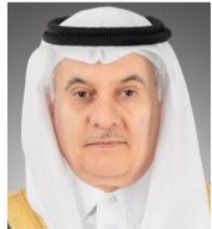
عبد الرحمن الفضلي

يفتح معالي وزير البيئة والمياه والزراعة المهندس عبدالرحمن بن عبدالمحسن الفضلي بالرياض اليوم الاثنين، أعمال الدورة الثالثة لمنتدى المياه السعودي، الذي تنظمه الوزارة تحت شعار "استدامة المياه مسؤوليتنا جميعاً"؛ لمناقشة التحديات التي تواجه قطاع المياه، ووضع حلول تكاملية لمعالجتها. ويشهد المنتدى الذي يستمر لمدة ثلاثة أيام، مشاركة واسعة لخبة من صنّاع القرار والمسؤولين الحكوميين، بالإضافة إلى مجموعة من الخبراء والمتخصصين في مجالات المياه من داخل المملكة وخارجها، إلى جانب شركات القطاع الخاص المحلية والعالمية، وتشارك فيه (35) دولة، وأكثر من (2000) مشارك، و (133) متحدثاً.