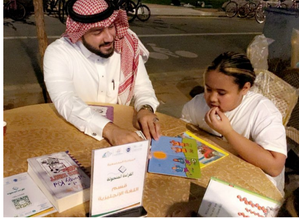
وقادر على تحمل المسؤولية، إضافة إلى تحفيز الصغار والشباب على القراءة وتنميتهم ثقافياً وتربوياً.