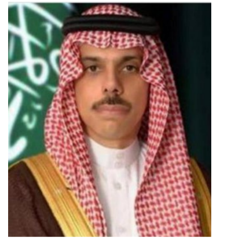
فيصل بن فرحان

يشارك صاحب السمو الأمير فيصل بن فرحان بن عبدالله وزير الخارجية، في المنتدى رفيع المستوى حول الأمن والتعاون الإقليمي بين دول مجلس التعاون لدول الخليج العربية والاتحاد الأوروبي. ويبحث سمو وزير الخارجية مع أصحاب السمو والمعالي والسعادة المشاركين في المنتدى سبل تعزيز التعاون بين دول الخليج والاتحاد الأوروبي في شتى المجالات، وأهمية التنسيق متعدد الأطراف، بالإضافة إلى مناقشة المستجدات على الساحتين الإقليمية والدولية، كما سيعقد سموه عدداً من اللقاءات الثنائية على هامش المنتدى.