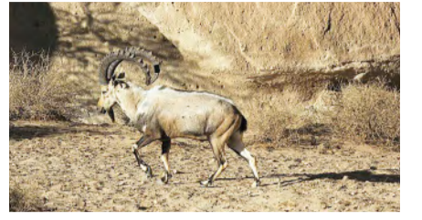
المدينة المنورة - البلاد

حصلت الهيئة الملكية لمحافظة العلا على العضوية الحكومية للاتحاد الدولي لحماية الطبيعة؛ نظير التزامها الكبير بجهود حماية البيئة الطبيعية في محافظة العلا، المتمثلة في دعم وتمكين المحميات وإدارة التراث الطبيعي من خلال قائمة الاتحاد الخضراء للمناطق المحمية والمحافظة عليها، ودعم تنفيذ إدارة واستعادة الطبيعة البرية، وتتيح هذه العضوية للهيئة الاستفادة من خبرات ومعلومات ١٨,٠٠٠ متخصص في الاتحاد، إضافة إلى مشاركة الهيئة تجاربها مع أعضاء الاتحاد في مشروعات إعادة التوازن البيئي في المحافظة أثناء اجتماعات الاتحاد الدولي لحماية الطبيعة والمؤتمرات التي تُعقد كل أربع سنوات، وأوضح الرئيس التنفيذي للهيئة الملكية لمحافظة العلا المهندس عمرو بن صالح المدني " أن هذه العضوية ستسهم بدعم جهود الهيئة في الحفاظ على التراث الطبيعي والحياة البرية عبر مجموعة من المبادرات التي خلقت لنا حضوراً فاعلاً في هذه المنظومة، كذلك ستساعدنا في تطبيق خططنا من خلال الاستفادة من الخبرات المتراكمة لحماية الطبيعة، على نحو يساهم في ترجمة رؤيتنا على أرض الواقع، ومشاركة الشركاء في المنظمة نموذج إعادة النظم البيئية التي طبقت في العلا".