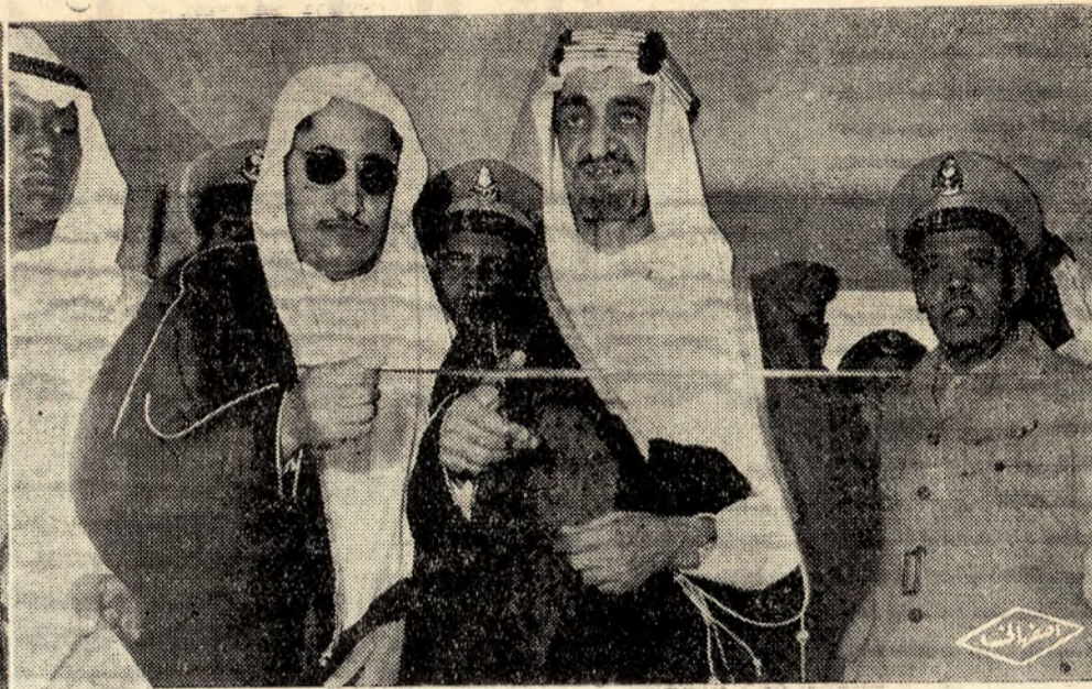
سمو الامير فيصل يقص الشريط ايذاناً بافتتاح مهرجان الطائف الرياضي