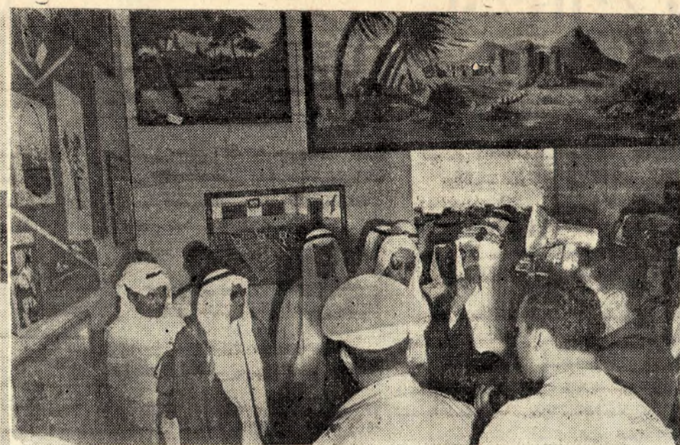
سموه يشهد معرضاً لاتساج المدارس في الدورة الصيفية بالطائف