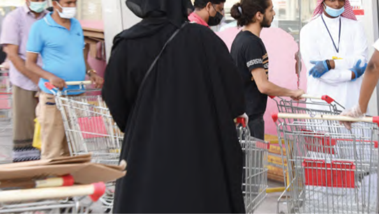
صيدلي يوزع الأدوية في صيدلية بمدينة جدة.

وتتمثل أعراض نزلة البرد في: انسداد الأنف، السعال والعطاس، وحمى خفيفة، وحذرت "فهد الطبية"، من ٣ أعراض شديدة، ناصحة بضرورة مراجعة الطبيب في حال الشعور بها وهي: ارتفاع درجة الحرارة لأكثر من ٣٨ درجة مئوية، وحمى مستمرة، وضيق في التنفس، وللمساعدة في التحسن بشكل أسرع، يجب على المريض اتباع ٣ تعليمات وهي: النوم الكافي، والإكثار من شرب السوائل، والغرغرة بالماء الدافئ.