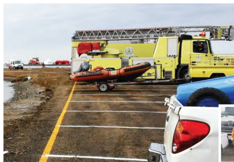
مركب إنقاذ بحري في ميناء جدة.