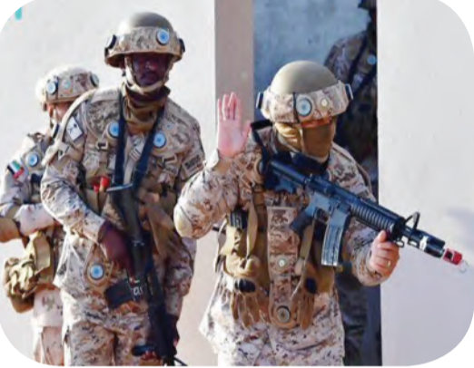
تمرين عسكري سعودي إماراتي

اللحظة والمنتشر بطريقة مخفية في أفريقيا. مؤكداً أن الإجراءات الاحترازية التي تواصل اتخاذها المملكة العربية السعودية وقفت سداً منيعاً أمام دخول هذا المتحور الخطير فضلاً عن وعي المواطن والمقيم على أرض المملكة في أهمية الالتزام بالإجراءات الاحترازية. أوضح مدير منظمة الصحة العالمية بالمملكة والشرق الأوسط الدكتور فهد الجوفى في تصريح لـ "البلاد" عدم وجود متحور فيروس كورونا الجديد "أوميكرون" في المملكة العربية السعودية ولا في أية دولة خليجية حتى