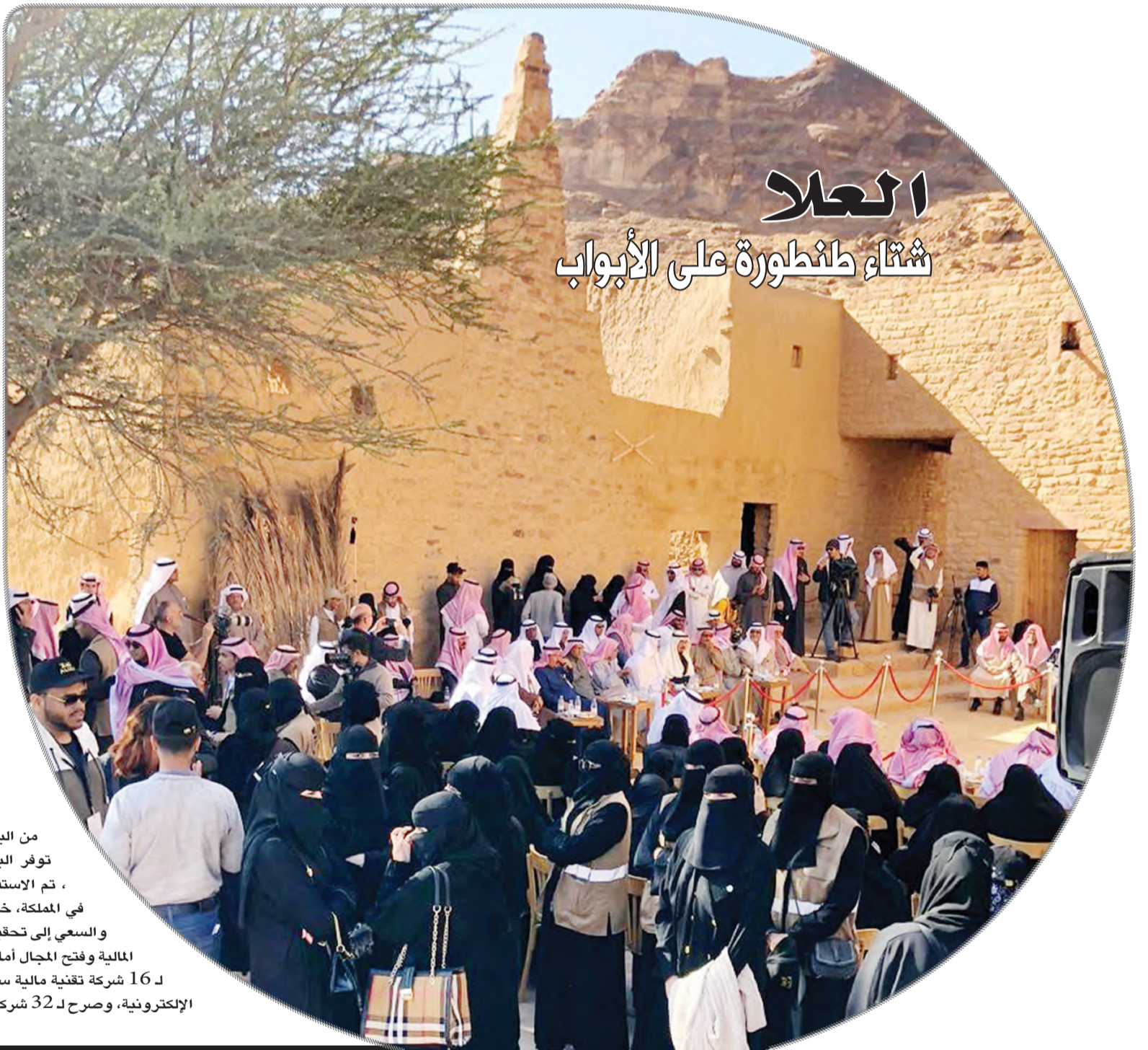
العلا شتاء طنطورة على الأبواب