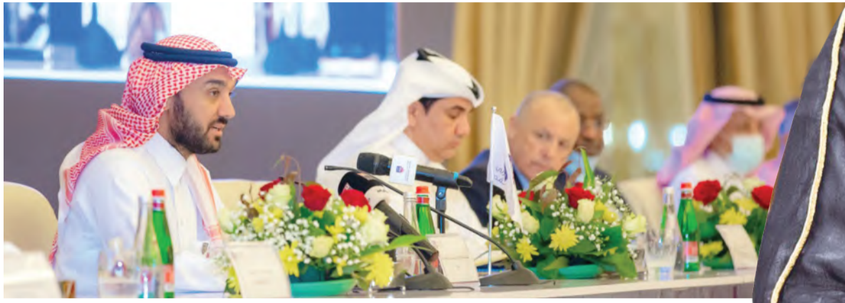
الرياض - هاني البشر

قدم صاحب السمو الملكي الأمير محمد بن سلمان بن عبد العزيز، ولي العهد نائب رئيس مجلس الوزراء وزير الدفاع، دعماً للاتحاد العربي لكرة القدم بقيمة 5 ملايين ريال.