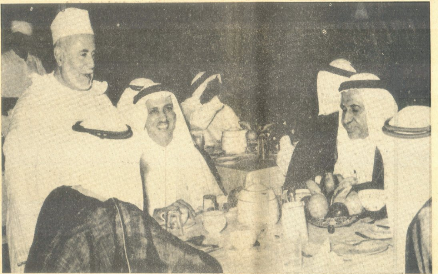
لقطة من احتفال سعادة السفير المغربي في جدة بعيد المغرب الوطني