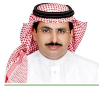
خالد بن عبد الرحمن العوض

"تحت رعاية أمير منطقة مكة المكرمة صاحب السمو الملكي الأمير خالد الفيصل، دشّن نائب أمير المنطقة صاحب السمو الملكي الأمير سعود بن مشعل بن عبدالعزيز، أعمال الملتقى الرابع لامارات المناطق للتجارب التنموية، الذي تستضيفه إمارة المنطقة على مدى يومين في جدة بحضور وكلاء مارات المناطق والوكلاء المساعدين للشؤون التنموية لفعاليات الملتقى الرابع لامارات المنطقة، والذي يضم مشاركة امارات مناطق و(23) جهة مشاركة، واطلع سموه على المجهودات والمبادرات التنموية التي نفذت في بعض المناطق". إن فكرة إقامة مثل هذا الملتقى، فكرة رائدة، وتمثل إجراء ينطلق من عمق المسؤولية، وغير مسبوق في مجاله، ووقوف المسؤول على مشاريع المناطق المنفذ منها