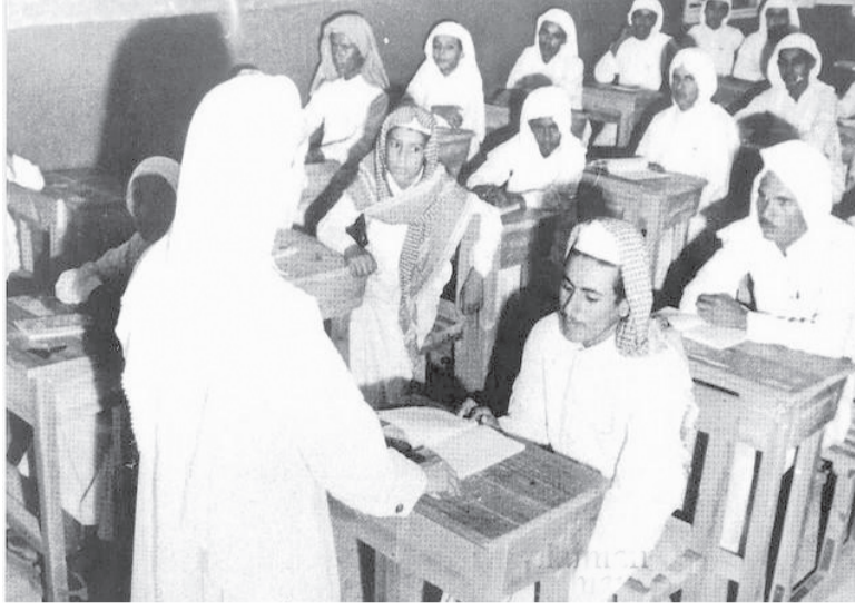
طلاب - ١٩٦١م - الرياض