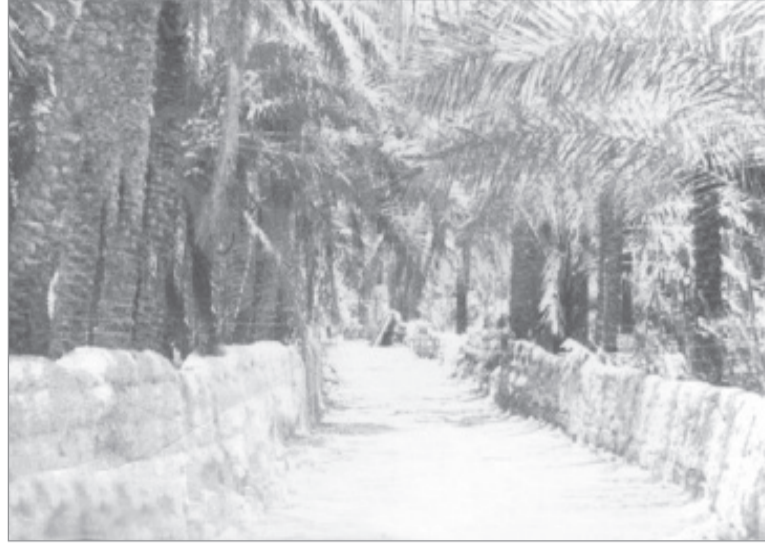
طريق بين المزارع - القصيم