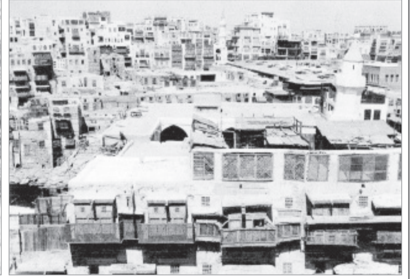
صورة لشارع قابل في القرن الرابع عشر

هذه المواد نشرت بتاريخ 17 - 4 - 1383 السبت 7/ 9/ 1963